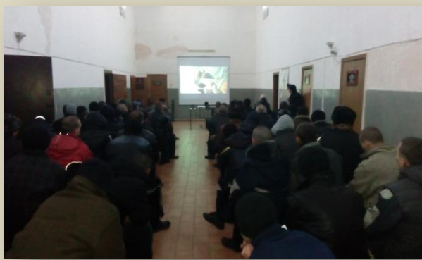
На очередном кинопоказе в Торецкой исправительной колонии № 2.

Центральная тема фестиваля в этом году – «Сквозь иллюзии». Сегодня страны и народы прощаются со многими своими иллюзиями, разрушается иллюзия о стабильности мироустройства, которую совместно выстраивали демократические страны. Перед гражданами Украины, в свою очередь, возникает фундаментальный вопрос: не настало ли время власти и обществу избавиться от иллюзии, что страну можно реформировать без реальных изменений, в частности, в экономической, социальной и культурной сферах?