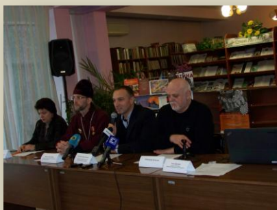
Пресс-конференция в городской библиотеке им В. Г. Короленко в Мариуполе

14 зарубежных и отечественных документальных фильмов посмотрели более двухсот зрителей городов Донбасса – Бахмута (бывший Артемовск), Дружковки, Торецка (бывший Дзержинск), Покровска (бывший Красноармейск). Кинопоказы состоялись во всех шести учреждениях исполнения наказаний области, расположенных на контролируемой Украиной территории, которые посмотрели около тысячи осужденных. В программу фестиваля в области включены и фильмы о событиях трехлетней давности из «Энциклопедии Майдана» - «Мова», «Остап», «Песня бойца», «Автомайдан» «Канцелярская сотня».