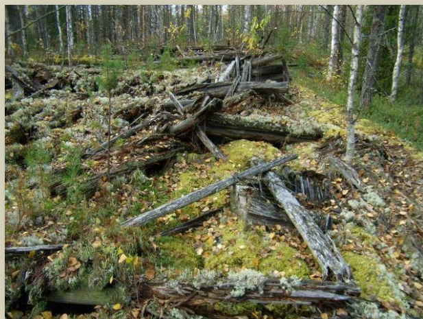
Там, где был Кулойлаг. Наше время