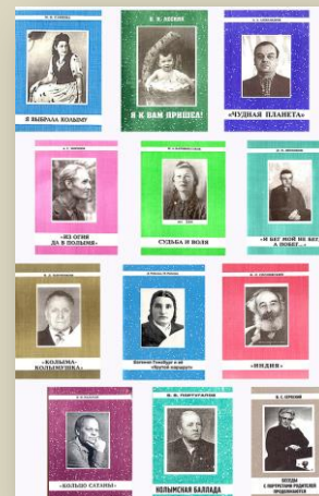
Книги, выпущенные И.А. Паникаровым с 1996 г. в серии «Архивы памяти»

А пока этого не случилось – буду дерзать!