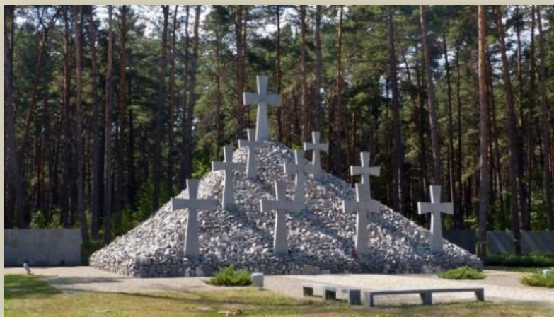
Историко-мемориальный заповедник "Быковнянские могилы" под Киевом.

Самое большое на Украине место захоронения расстрелянных и замученных советской властью людей.