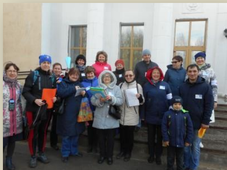
Координаторы и наблюдатели Мемориала

Трудности возникли с вопросом о массовых арестах врачей и названием персоналий по портретам. Пришлось воспользоваться подсказкой, хотя за нее начислялись штрафные баллы. Не обошлось и без курьезов. Некоторые игроки называли СПИД, как одно из распространенных заболеваний среди заключенных. А кому-то пытались подсказать ответы любопытные печорцы, привлеченные санитарными повязками на руках координаторов.