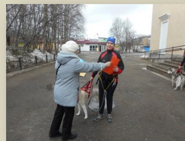
Вручение маршрутных листов

Командам предстояло побывать на десяти точках, зашифрованных загадками. Чтобы выйти, например, к парку им. Володи Дубинина, нужно знать, что «Инициатором открытия данного объекта были врачи 8-й больницы, а в его создании принимали участие жители города». На маршруте их встречали координаторы с вопросами по теме «Становление медицины в Печоре». Ребятам нужно было показать, что они запомнили из лекций и нашли самостоятельно в источниках.