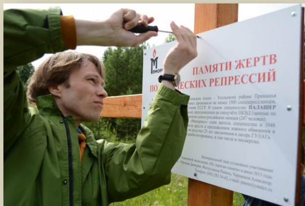
Установка мемориального знака во время экспедиции "По рекам памяти" на месте бывшего спецпосёлка Палашер

И последнее. Те молодые люди, с которыми мы ведём историко-просветительскую работу, живут не изолированно. Они живут в этом обществе, их родители ещё не так давно назывались «советский народ». «Мемориал» хорошо осознаёт это. В последние годы из недр российского общества исходит потребность защититься от прошлого через забвение трагических страниц истории своей страны. Тем самым люди хотят найти силы для дальнейшей спокойной жизни. Огромное и опасное заблуждение! Поэтому все наши усилия направлены на то, чтобы противостоять наступлению исторической пустоты, чтобы работать с молодёжью, работать профессионально и целеустремленно, работать с максимальной отдачей. Потому что мы верим в демократическое будущее России.