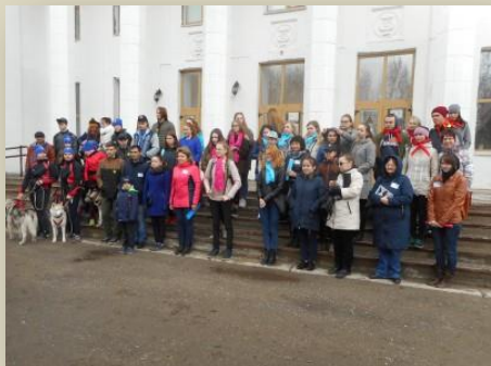
Общее построение команд-участников Квеста

П ечорское отделение общества «Мемориал» активно занимается просветительской деятельностью в молодежной среде. Одной из форм такой работы является квест, проводимый по различным направлениям, связанным с историей репрессий на территории нашего города и района. Темой этого года стало «Становление медицины в Печоре».