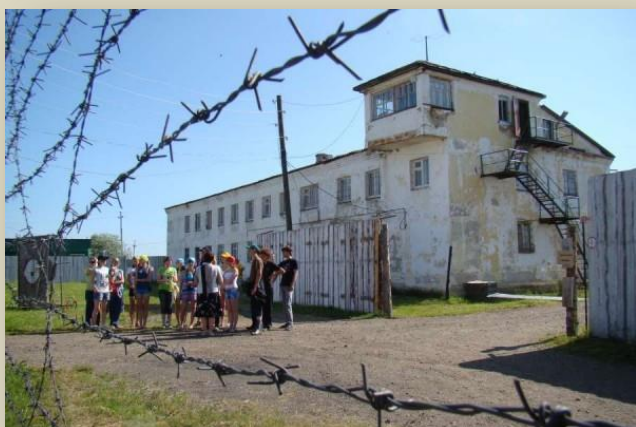
Экскурсия для волонтеров в Мемориальном музее истории политических репрессий «Пермь-36»

Этот подход – история через судьбу отдельного человека – положен в основу создания передвижного выставочного комплекса по истории политических репрессий. Обдумывая тематику выставок, мы пришли к убеждению, что наилучший способ заставить зрителя задуматься о трагических уроках прошлого – это рассказать о конкретных, ещё не затёртых официальными публикациями темах, где в центре внимания – живой человек со своей личной, но и общей историей. Человек близкий, понятный, живший или живущий рядом, в Перми, ходивший по тем же улицам, что и нынешнее поколение молодых.