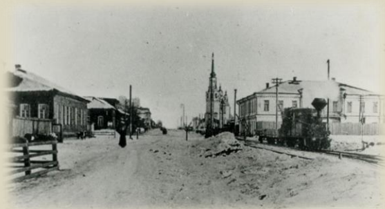
Богословск, Свердловской обл.

Осиротевших детей передали в детдом, представляющий собою холодный сырой барак. Чтоб не околеть, с утра до вечера жарили буржуйку. Из еды выдавали кусочек хлеба и воду.