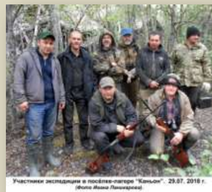
Участники экспедиции в посёлке-лагере «Каньон», 29.07. 2018 г.

Кирпичная стена вольного клуба выглядела «солидно». А напротив – добротное деревянное жилое помещение для вольных на два хозяина. В обеих квартирах – кирпичные печки, понизу – трубы водяного отопления, кое-где и чугунные радиаторы сохранились. Было и электричество. Таких «хором» - четыре-пять... Все строения обследовали капитально и пришли к выводу, что и здесь люди веселились, танцевали и пели, отмечали праздники, женились и рожали детей...