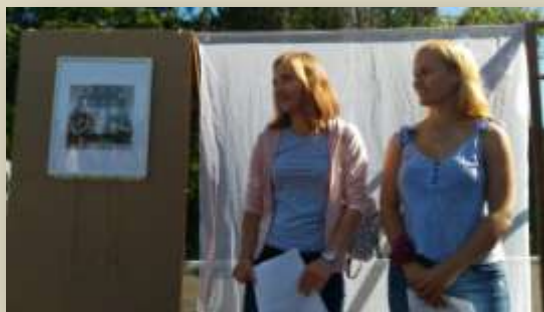
Презентация арт-объекта «Зафиксируй память» (русский перевод названия волонтерского лагеря)