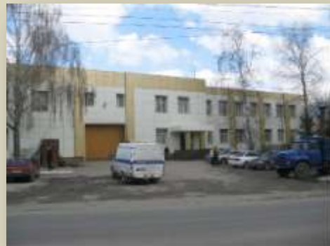
Обновлённый вид Брянской тюрьмы екатерининских времен, где в камере №12 сидел В.П. Чкалов(ныне - СИЗО №1)