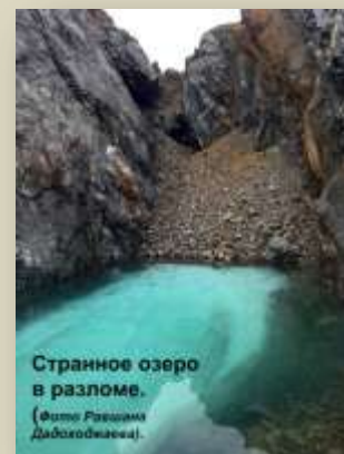
Странное озеро в разломе. (Фото Рашида Даболовцева).