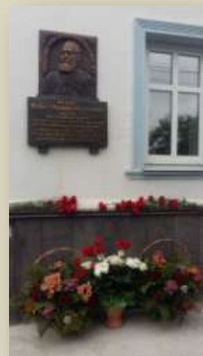
Памятная доска священномученику Неофиту Любимову

В частности, в августе намечено проведение первого круглого стола, с участием представителей правительства Ульяновской области, представителей Симбирской епархии, докторов исторических наук, Уполномоченного по правам человека Ульяновской области, скульпторов и других.