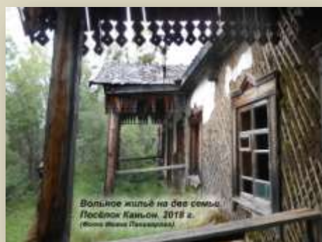
Вольное жильё на 2 хозяина, Каньон, 29.08.2018г.

Участники Экспедиции, Каньон, 29.07. 2018г.