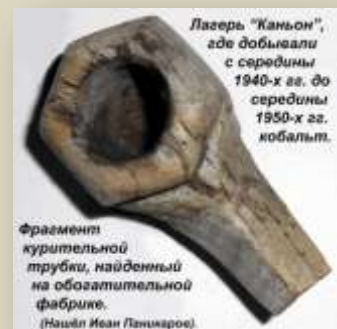
Лагерь "Каньон", где добывали с середины 1940-х гг. до середины 1950-х гг. кобальт.