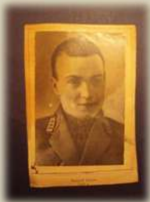
Валерий Чкалов. 1928 год