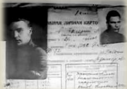
Личная карточка осужденного В.П. Чкалова

«5 января. Читал только что книгу Либединского «Коммунисты». Бросил читать, надоело. Ходить по камере негде, очень мала... Принесли обед. Только чувство голода заставляет есть эту грязную мутную бурду. Совершенно безвкусную. Вопрос «За что?» стоит в голове, и никак его не выкинешь. Читаю книгу «Остров погибших кораблей» Беляева. Прочел все 333 страниц. Читал не отрываясь. В это время женщины мыли коридор и ругались хуже, чем мужчины. Как режет слух, когда ругается женщина, но что делать. Каменный мешок имеет и над ней свою власть и свое воспитание».