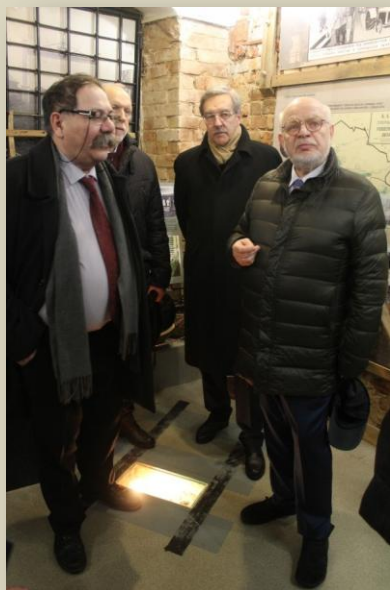
Посещение Мемориального музея «Следственная тюрьма НКВД»