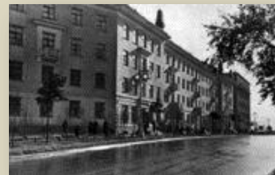
Улица Кондрикова в г. Кировске