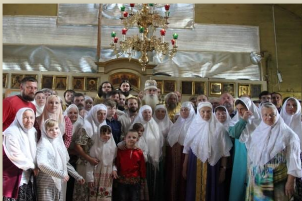
Беженцы-старообрядцы, вместе с местными старообрядцами, в древнейшем старообрядческом деревянном храме Рождества Богородицы и святителя Николы в г. Новозыбкове Брянской области

Много возникало (и – возникает!) проблем у беженцев, если, не дай Бог, просрочен украинский паспорт; если не вклеена в него фотография по возрасту; если в фамилии или в имени не та буква, как в свидетельстве о рождении; если неточно сделан перевод документа с языка страны исхода на русский язык; если нет подтверждающего документа о добрачной фамилии или о расторжении брака... Сотни «если»! И, надо же, несмотря на то, что беженцам предоставлен статус ВУ, что им нельзя выезжать из России, часто миграционные чиновники требуют, чтобы они возвратились в страну исхода, «выправили» бы там все свои документы и вернулись обратно.