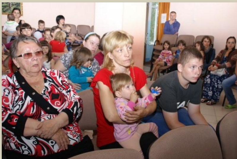
Беженцы из Луганской области в Брянске

Действительно, наш регион принял несколько десятков тысяч украинских беженцев. Благо в отношении братьев-славян действовали утвержденные Правительством РФ «Временные правила...», которые ныне, к сожалению, отменены, хотя беженцы из Украины продолжают прибывать. Но обустроить всех в «чистой зоне» практически невозможно, и беженцы вынуждены селиться семьями, с малыми детьми, в юго-западных районах области, подвергшихся радиационному загрязнению в результате катастрофы на Чернобыльской АЭС. Так что климат не у всех беженцев «подходящий», ибо ныне многие семьи проживают в местностях, официально именуемых зоной отчуждения, зоной отселения, зоной проживания с правом на отселение, зоной проживания с льготным социально-экономическим статусом. Правда, ежемесячно выплачивают им за это денежное пособие, по-народному «гробовые», но оно настолько мизерное, что только возмущает людей.