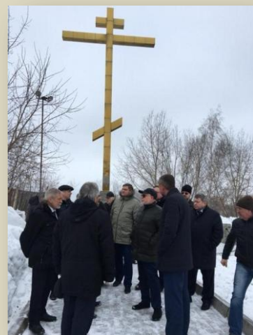
У Поклонного креста памяти репрессированных

Вторым пунктом программы было посещение Мемориального музея истории политических репрессий «Следственная тюрьма НКВД», а перед этим возложение цветов в Сквере памяти перед музеем у памятника жертвам большевистского террора на Томской земле.