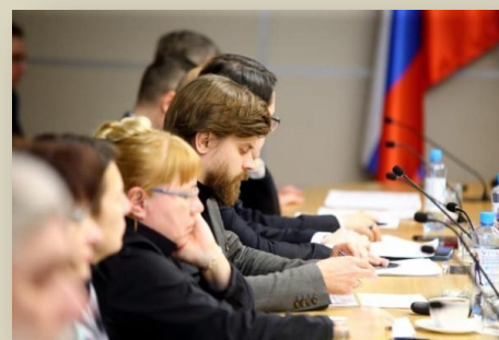
На заседании в Администрации Томской области

Томской области, но и для России в целом. Так, в повестке заседания были заслушаны и обсуждены следующие вопросы: «О реализации в Томской области Концепции государственной политики по