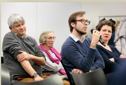
Дискуссия после доклада

В заключение доклада были процитированы строки из Заявления Правления Международного Мемориала о дискуссии вокруг Стены памяти в Коммунарке: «...заметим, что упреки и обвинения, выдвинутые против общества «Мемориал» и Музея истории ГУЛАГа, при всей их поверхностности, запальчивости и наивной категоричности, вызваны причиной, заслуживающей внимания и уважения: потребностью в осмыслении трагического советского прошлого. Общество до сих пор не выработало критериев и механизмов, которые позволили бы дать объективную историко-правовую оценку конкретных преступлений, совершенных Советским государством, и определить меру вины конкретных лиц, замешанных в этих преступлениях. Конечно, братские могилы – не самое подходящее место для споров о персональной ответственности за деяния преступного режима. Правление общества «Мемориал», тем не менее, надеется, что завязавшаяся дискуссия – если она, конечно, примет более культурный и глубокий характер – станет продолжением серьезного и содержательного разговора на эти темы».