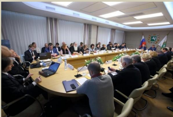
Выездное заседание межведомственной Рабочей группы

Проводил заседание Михаил Федотов - председатель Совета при Президенте Российской Федерации по развитию гражданского общества и правам человека. В выездном заседании принимали участие члены