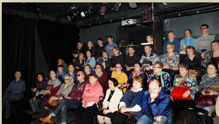
Участники презентации на просмотре фильма

Презентация фильма прошла 5-го апреля 2019 года в помещении театра КНАМ, имеющим лучшую аппаратуру в городе и зал с полным затемнением.