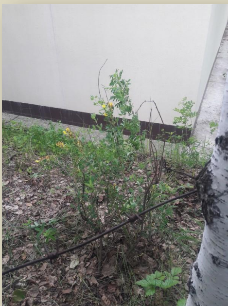
Остатки ограждения из колючей проволоки в непосредственной близости от нового тира

Весьма вероятным представляется, что здания (с капитальным фундаментом, в котлованах) возведены с разрешения властей, земля отдана в недорогую аренду на неизвестное количество времени с последующим переходом зданий в собственность государства и возможным объединением с "биатлонным хозяйством".