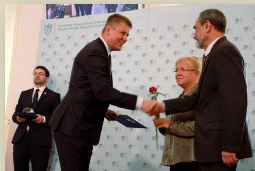
Министр иностранных дел Чехии Томаш Петржичек вручает премию «Gratias Agit» за распространение доброго имени Чешской Республики.

Общество «Мемориал» получило премию «Gratias Agit» за распространение доброго имени Чешской Республики. Это высшая чешская награда за деятельность, связанную с чешской культурой и историей за рубежом. Чехия, таким образом, выразила свою благодарность Мемориалу за организацию разных мероприятий (выставки, конференции) связанных, например, с вторжением советских войск в Чехословакию в августе 1968 года и с объективным взглядом на исторические события, связанные с чешской историей. Благодаря мемориальским базам данных сейчас можно легко найти чехов или чехословацких граждан среди жертв советских репрессий, что очень облегчает работу чешским исследователям.