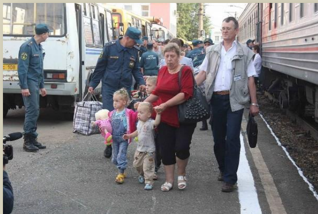
Украинские беженцы в Брянске

И по сей день многие украинские беженцы и трудовые мигранты выбирают местом жительства и работы наш небогатый регион. В целом, сотрудничество органов власти и Брянского пункта юридической сети «Миграции и Право» ПЦ «Мемориал» по вопросам легализации, обустройства и трудоустройства беженцев, можно назвать удачным.