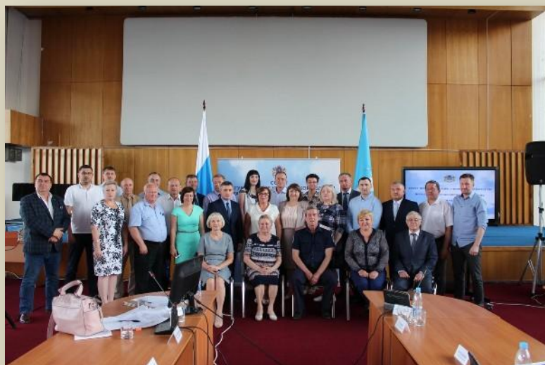
Совет при Губернаторе Ульяновской области по развитию гражданского общества и правам человека.

Совет начнет работу с составления графика выездов членов совета в муниципальные образования Ульяновской области по «кустовому» принципу для составления «пула» проблемных вопросов. Выезды планируется осуществлять на протяжении летнего региона. С целью максимального вовлечения жителей всего региона к решению актуальных вопросов, к участию в выездных заседаниях будут приглашаться лидеры общественного мнения: члены Советов по общественному контролю в муниципальных образованиях, члены Общественной палаты и Детской Общественной палаты Ульяновской области, представители ТОСов и иные представители общественности.