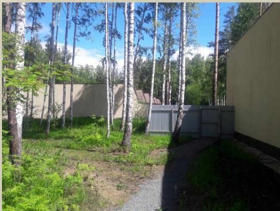
Забор между тирами в 500 м от Мемориала 12 км

Когда-то был установлен статус кво – власти на месте найденного захоронения создали мемориальный комплекс, на стелах которого увековечены более 18 тысяч имен расстрелянных; на территориях бывшего полигона НКВД не производились никакие строительные работы; екатеринбургский Мемориал не предпринимал давления с целью установления мемориального статуса всего участка, на котором предполагались захоронения.