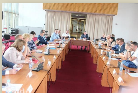
На заседании обновленного Совета при губернаторе Ульяновской области

Совет при губернаторе Ульяновской области, существующий уже более десяти лет, будет работать по новой схеме и в новом составе.