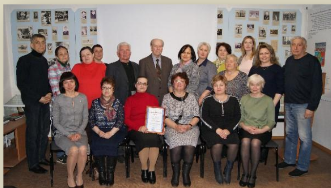
Фотография на память

В завершение встречи каждый получил буклет о 30-летней деятельности Печорского отделения общества «Мемориал».