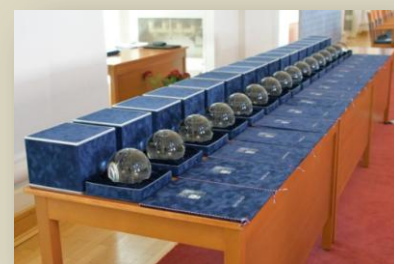
Хрустальный глобус премии «Gratias Agit»