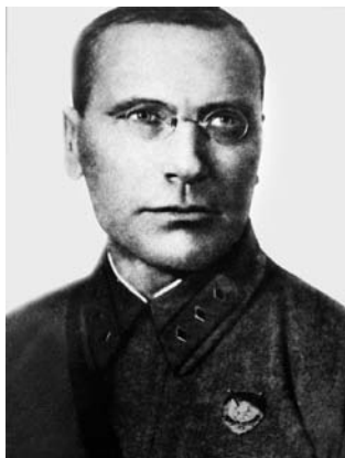
Командующий войсками СибВО комкор Я. П. Гайлит. Переведен на должность командующего войсками УрВО и 15 августа 1937 г. арестован, приговорен к расстрелу 1 июля 1938 г.