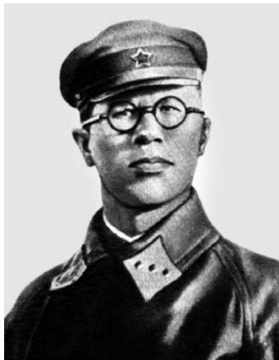
Помощник командующего СибВО по авиации комдив К. В. Маслов. Арестован 13 января 1938 г. приговорен к расстрелу 4 июня 1937 г.