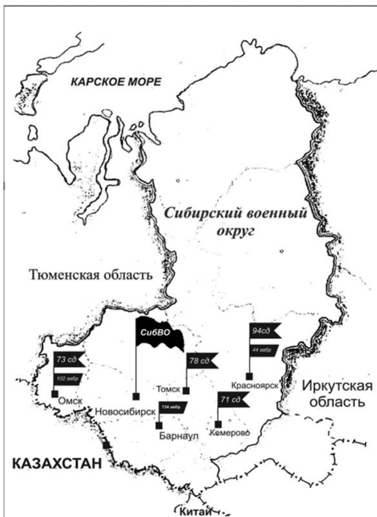
Схема дислокации соединений СибВО на январь 1938 года