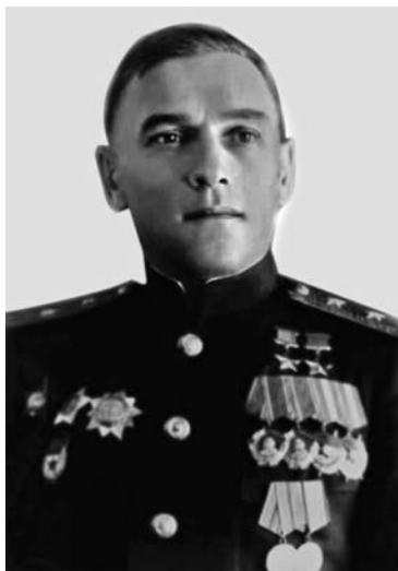
Командир 44-й авиабригады полковник В. Г. Рязанов. Арестован 12 марта 1938 г., освобожден 21 июля 1939 г. (На фото — генерал- лейтенант авиации, дважды Герой Советского Союза)