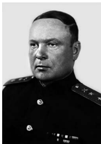
Начальник артиллерии СибВО комбриг Н. А. Дереш. Уволен из РККА 30 декабря 1937 г., позже восстановлен. (На фото — генерал-лейтенант артиллерии)