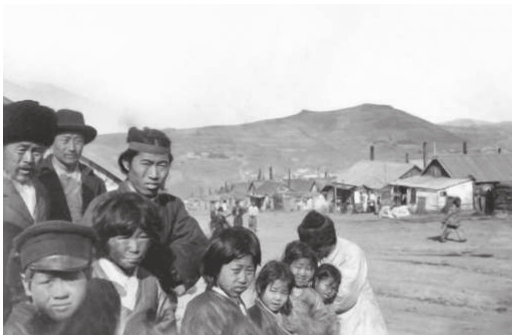
Владивосток. Корейская слободка. 1904 г. Автор: Штейн А.К. // ПГОМ. МПК 16045—4. Ф 36924