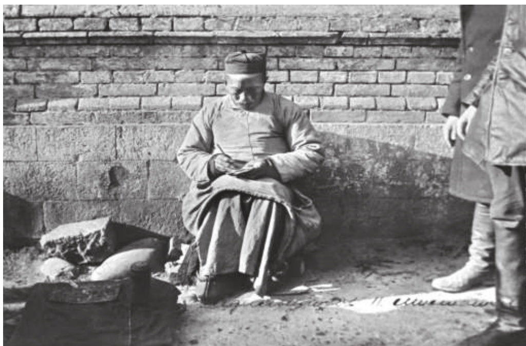
Китайский гадалщик. «Миллионка». Владивосток. 1933 г. // ГАПК. Ф. 25. Оп. 6. Д. 4. Л. 25