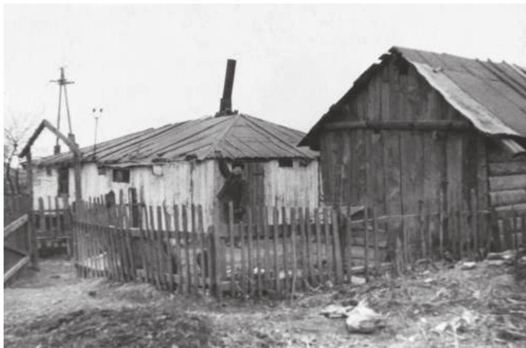
Старые корейские фанзы в пос. Липовцах. 1950-е гг.