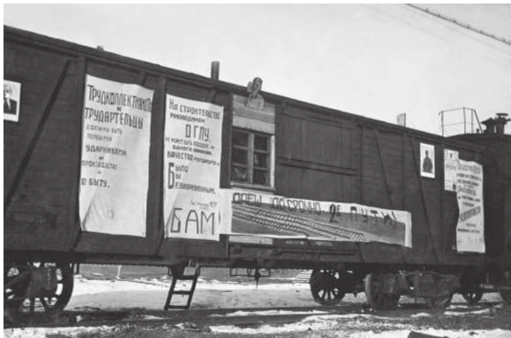
Вагон-электростанция на строительстве вторых путей БАМа. 1933 г.