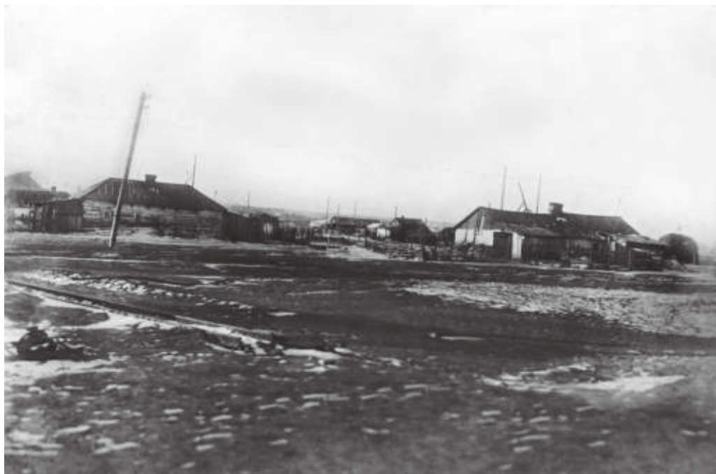
Пос. Липовцы Приморского края. 1945 г. // ГАПК. П-2498 а