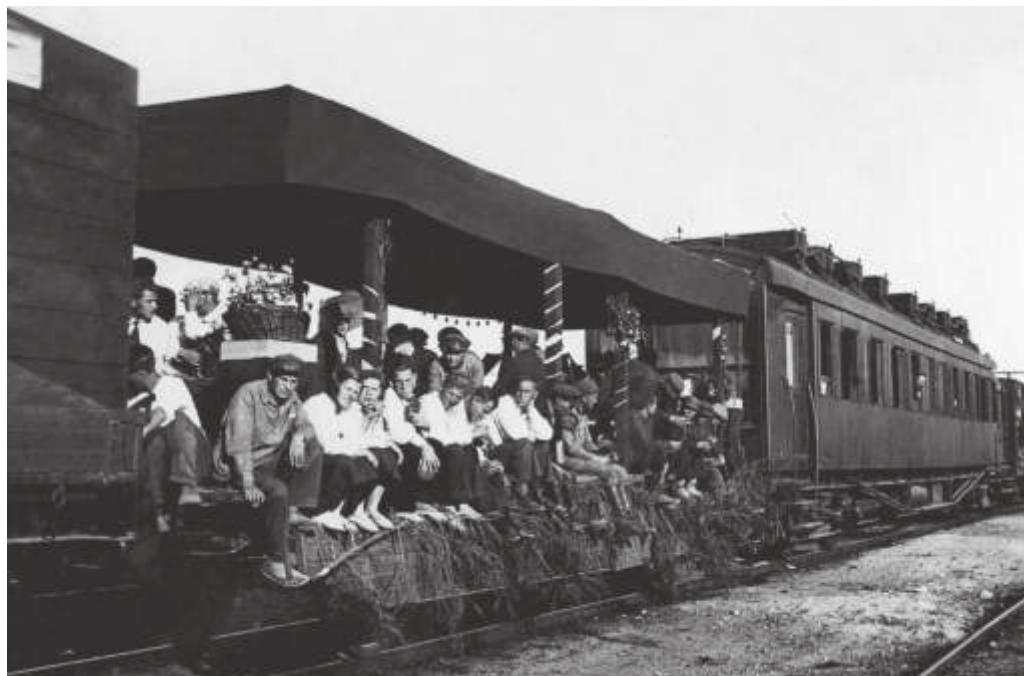
На слёте ударников строительства вторых путей БАМа. Ст. Мухинская. 1935 г. // РГИА ДВ. Ф. Р-2475. Оп. 3. Д. 18. Л. 6-об