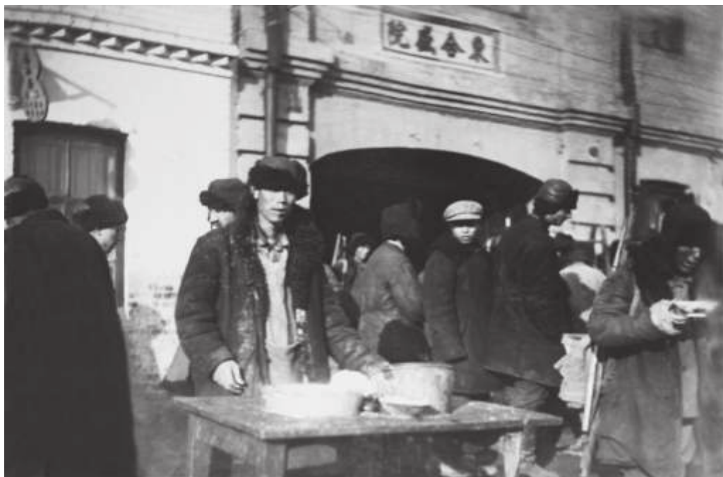
Китайская харчевня на ул. Семеновской г. Владивостока. 1935 г. // ГАПК. Фотоальбом №10. Фото 50