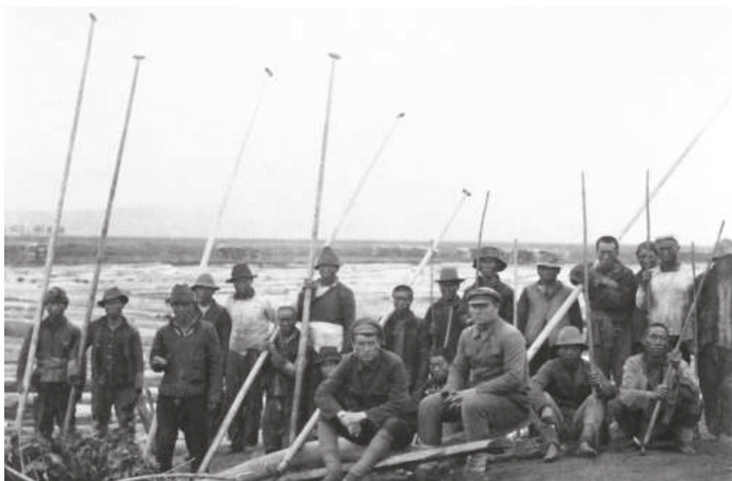
Лесорубы на молевом сплаве леса. Приморье. 1920-е гг. Автор: Гершков М. // ПГОМ. МПК 2725—33а. Ф 9819