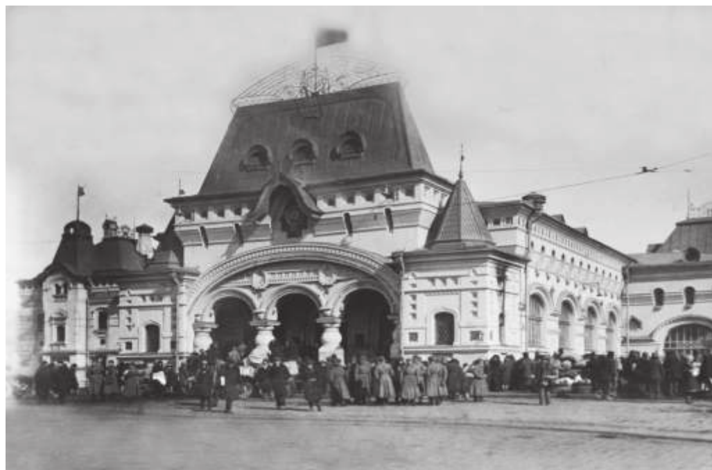
Владивосток. Железнодорожный вокзал. 1935 г. // ГАПК. Фотоальбом №10. Фото 9