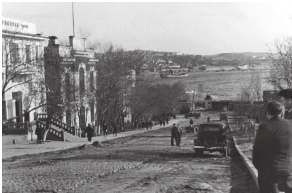
Реконструкция ул. Первого Мая (совр. ул. Петра Великого) во Владивостоке. 1950 г. Автор: Потапов Н.А. // ПГОМ. МПК 272—26. Ф. 24693