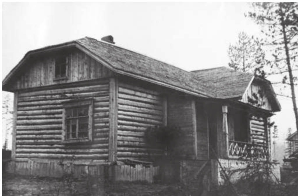
Жилой дом в колонизационном посёлке в Тынде. 1935 г.