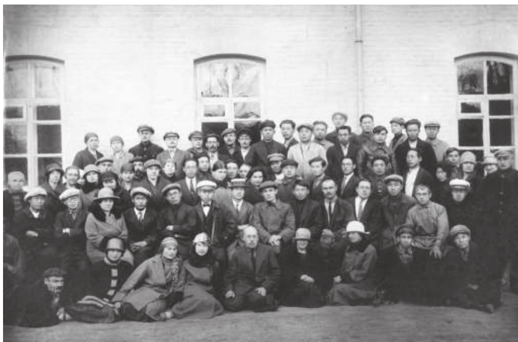
Корейцы в числе учащихся и преподавателей Ворошиловского педагогического училища. г. Ворошилов (совр. Уссурийск). 1930-е гг. // ПГОМ. МПК 5172—65—3. Ф 17217