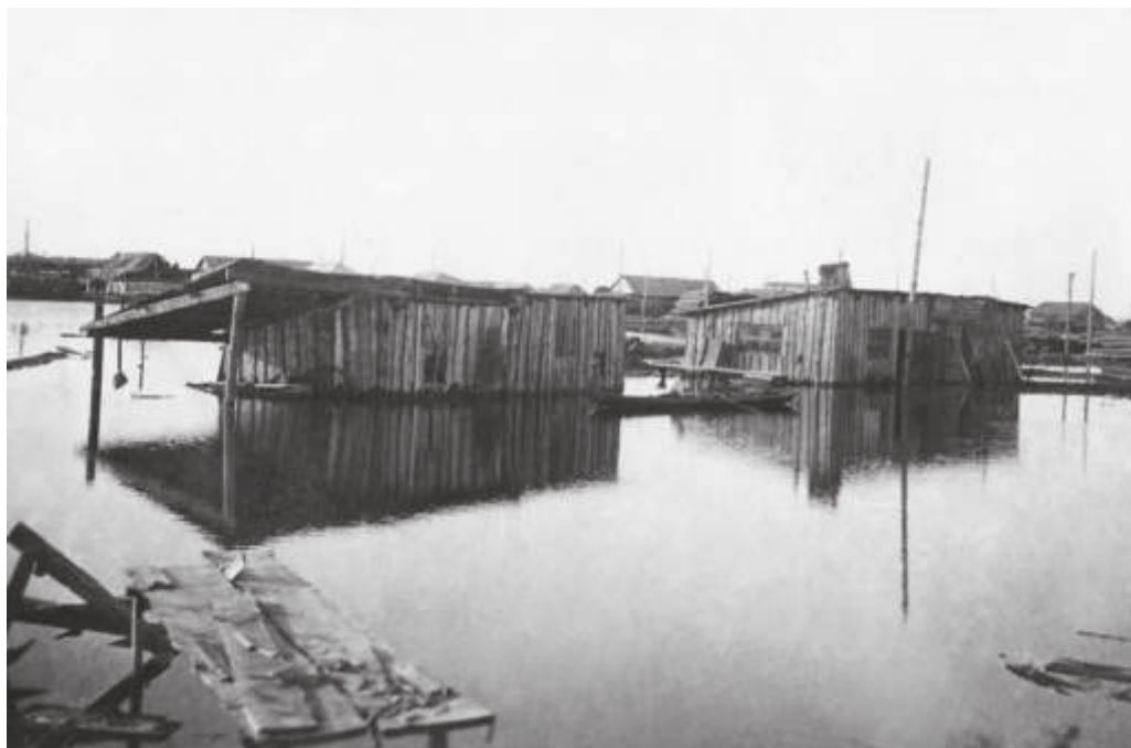
Наводнение в районе строительства БАМа. 1935 г.