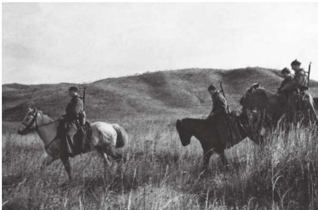
Пограничники Посьетского погранотряда в дозоре. Приморский край. 1938 г. Автор: Назаров Н.А. // ПГОМ. НВ 961—8