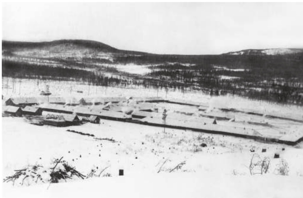
Общий вид пос. Бушуйки (Амурская область). Январь 1933 г.