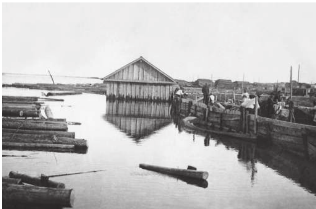
Наводнение в районе строительства БАМа. 1935 г. // РГИА ДВ. Ф. Р-2475. Оп. 3. Д. 17. Л. 26