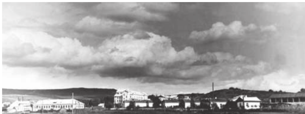
Шахтёрский посёлок в г. Ворошилове. 1955 г. // ГАПК. Фотоальбом №8. Фото 41