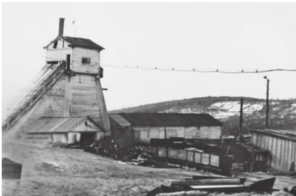
г. Сучан, шахта №24, введена в действие в 1944 г. // ГАПК. Фотоальбом №3. Фото 20