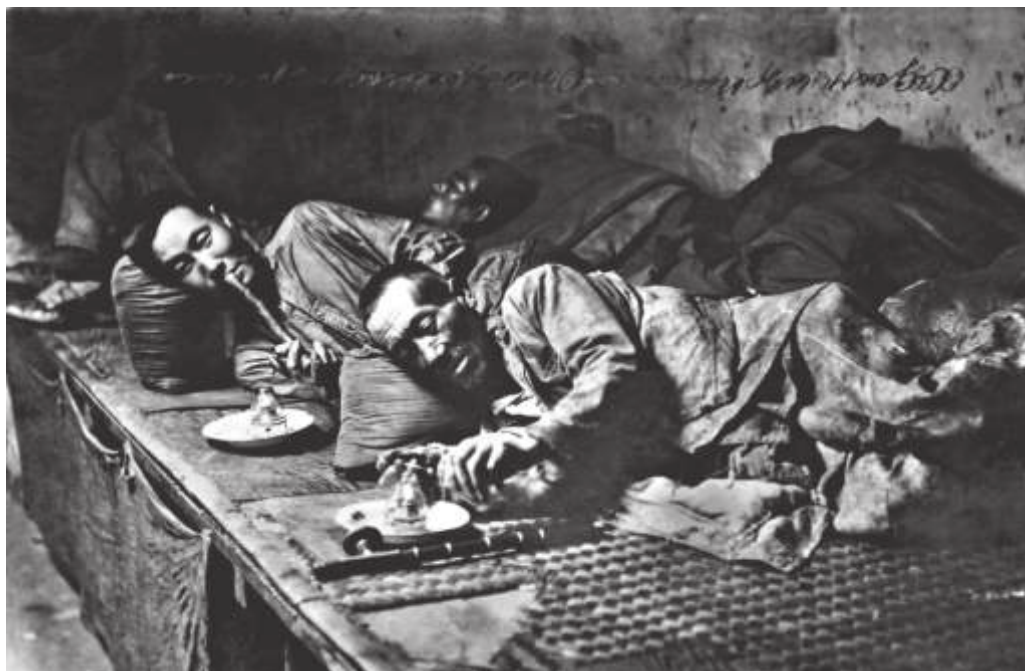
Притон опекурения в «Миллионке». Владивосток. 1933 г.