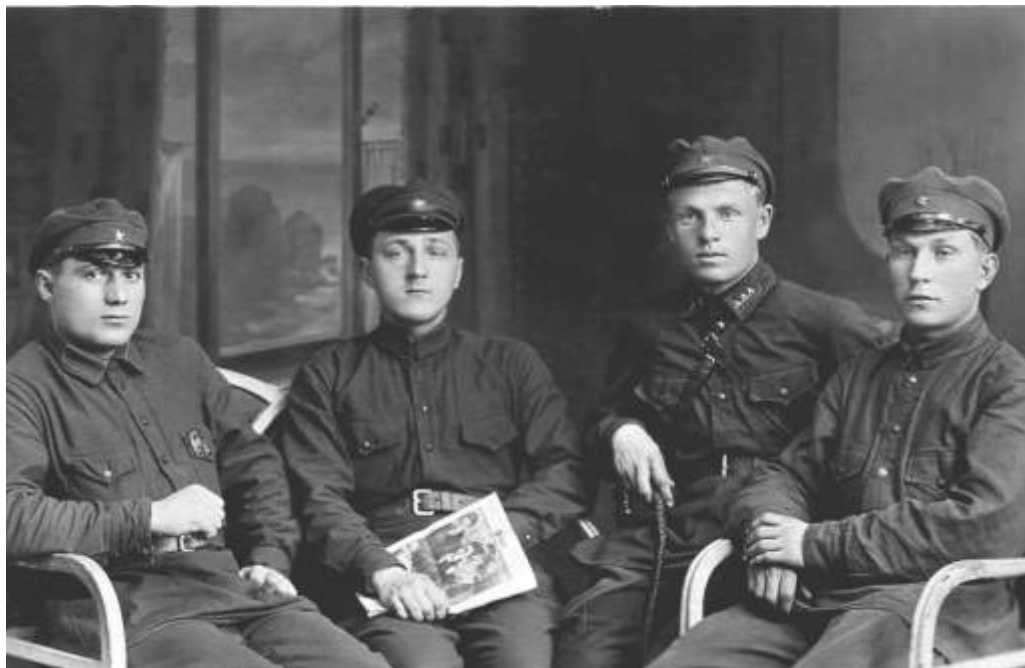
В погранотряде 58-го Уссурийского кавалерийского полка ГПУ. Владивостокский округ (совр. Приморский край). 1929 г. // ПГОМ. МПК 5162—1г. Ф 23410