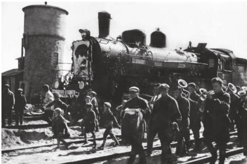
На слёте ударников строительства вторых путей БАМа. Ст. Мухинская. 1935 г.