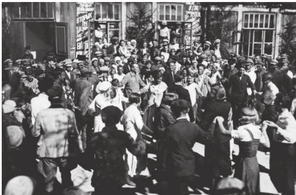
На слёте ударников строительства вторых путей БАМа. Ст. Мухинская. 1935 г. // РГИА ДВ. Ф. Р-2475. Оп. 3. Д. 18. Л. 7