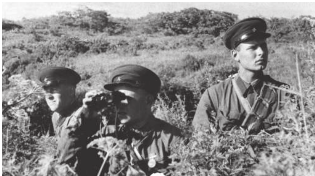
Пограничники Хасанского погранотряда в дозоре. Приморский край. 1938 г. Автор: Русанов П.В. // ПГОМ. НВ 961—1