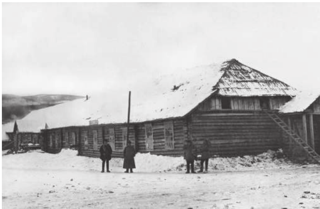
Клуб в пос. Бушуйке. Январь 1933 г.