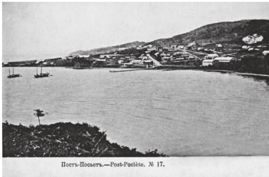
Пост Посъет. Приморская область (совр. Хасанский район Приморского края). 1910 г. // ГАПК. П-2252