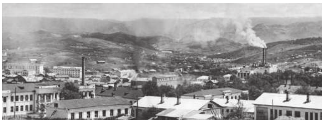
Общий вид г. Сучана (совр. г. Партизанск, Приморский край). 1952 г. // ГАПК. П-3351