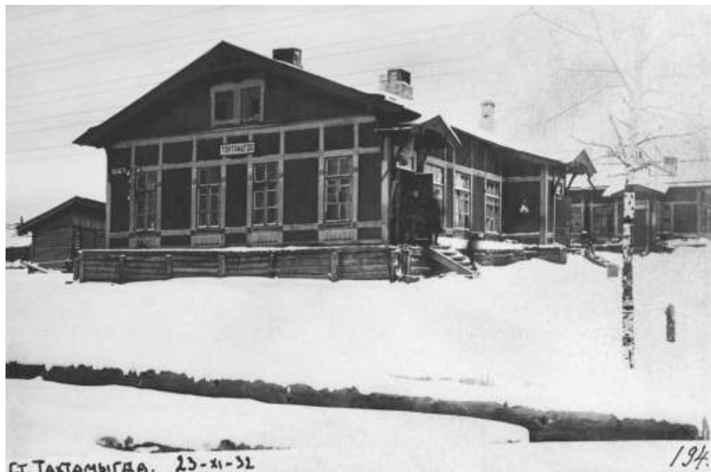
Ст. Тактамыгда на БАМе. Декабрь 1932 г.