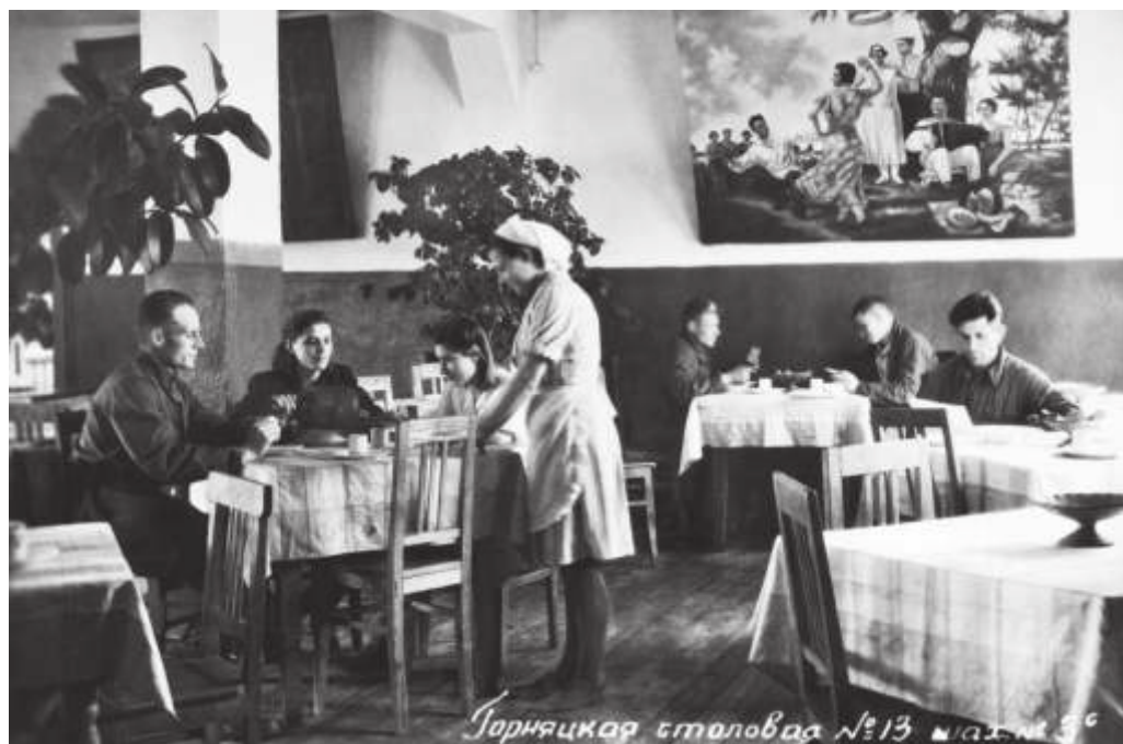
Столовая горняков №13 шахты 3-ц в г. Артеме. 1948 г.