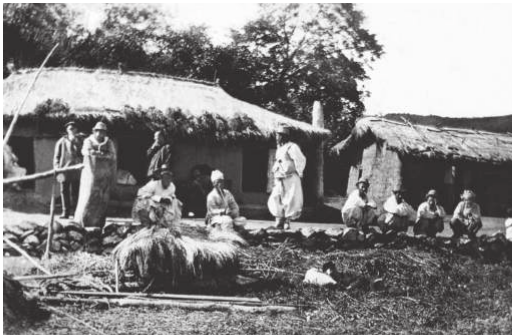
Корейские фанзы в бухте Находка. Приморская область. 1901 г. Автор: Прэй Э.Г. // ПГОМ. МПК 16045—9. Ф 36929