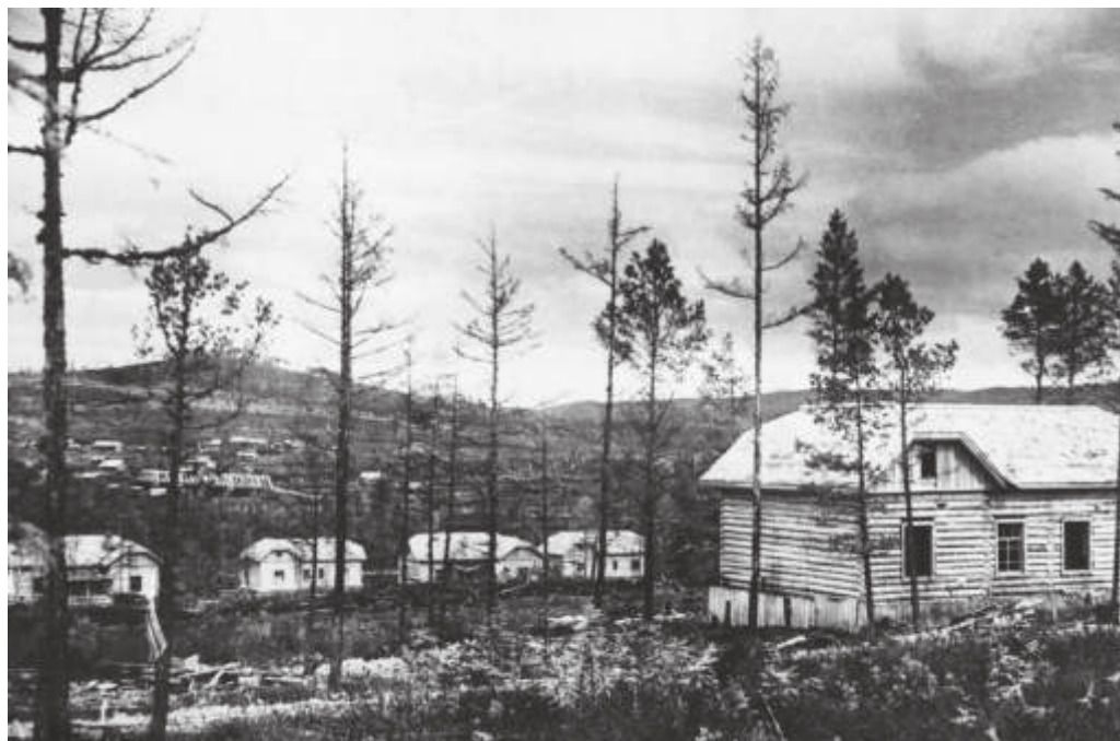
Колонизационный посёлок в Тынде (БАМлаг). 1935 г.