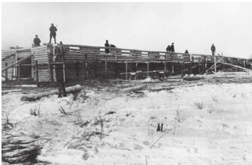
Строительство конюшни в пос. Большом Невере. Январь 1933 г.