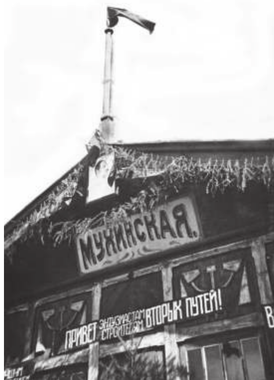
Ст. Мухинская на БАМе. 1935 г. // РГИА ДВ. Ф. Р-2475. Оп. 3. Д. 18. Л. 6-об