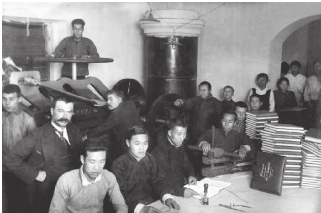
Китайские рабочие в переплетной мастерской редакции газеты «Дальний Восток». Владивосток. 1917 г. Автор: Смутьский И.Ф. // ПГОМ. МПК 4064. Ф 6698