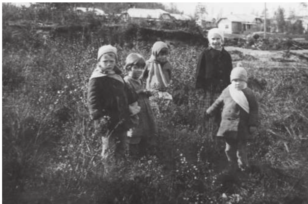
Дети колонистов в Тынде. 1935 г.