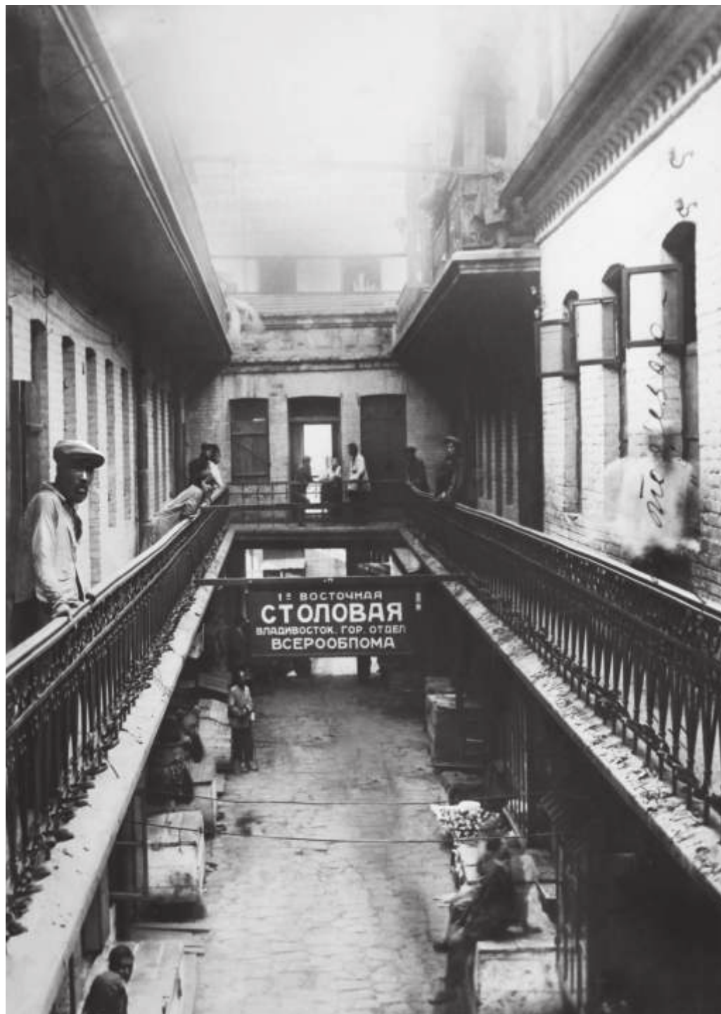
Один из внутренних дворов «Миллионки». Владивосток. 1933 г.