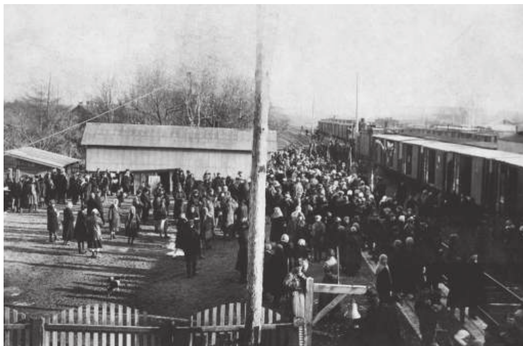
Отправление поезда со ст. Лазо. Владивостокский округ (совр. Приморский край). 1927 г. // ПГОМ. МПК 4928—3. Ф 25168