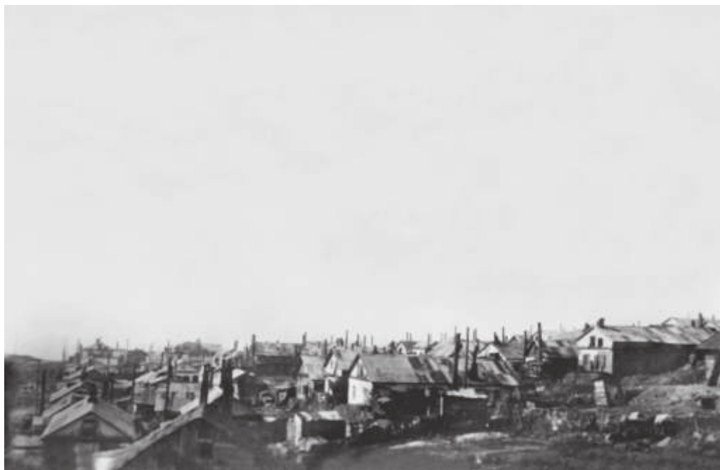
Владивосток. Корейская слободка. 1935 г. // ГАПК. Фотоальбом № 10. Фото 46