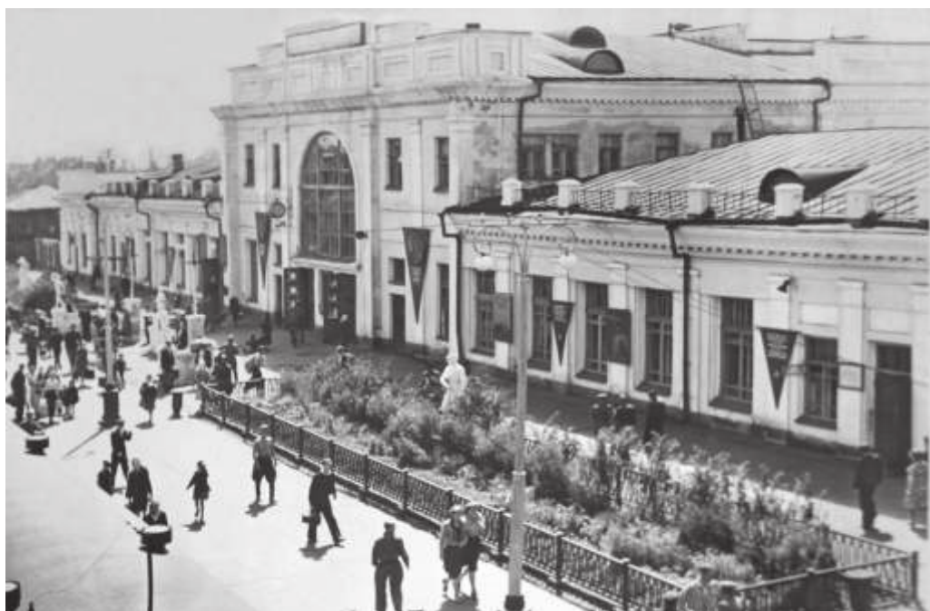
Железнодорожный вокзал г. Ворошилова (совр. г. Уссурийск, Приморский край). 1955 г. // ГАПК. Фотоальбом №8. Фото 2.