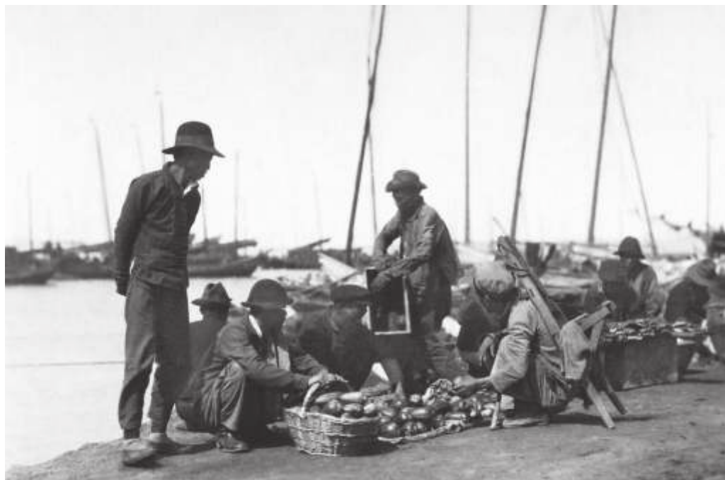
Китайский базар на берегу Амурского залива. Владивосток. 1927—1934 гг. // ПГОМ. МПК 3943—8. Ф. 13270