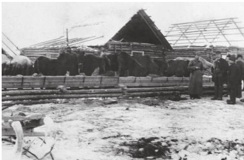
Большие лошади в пос. Бушуйке.

Январь 1933 г.