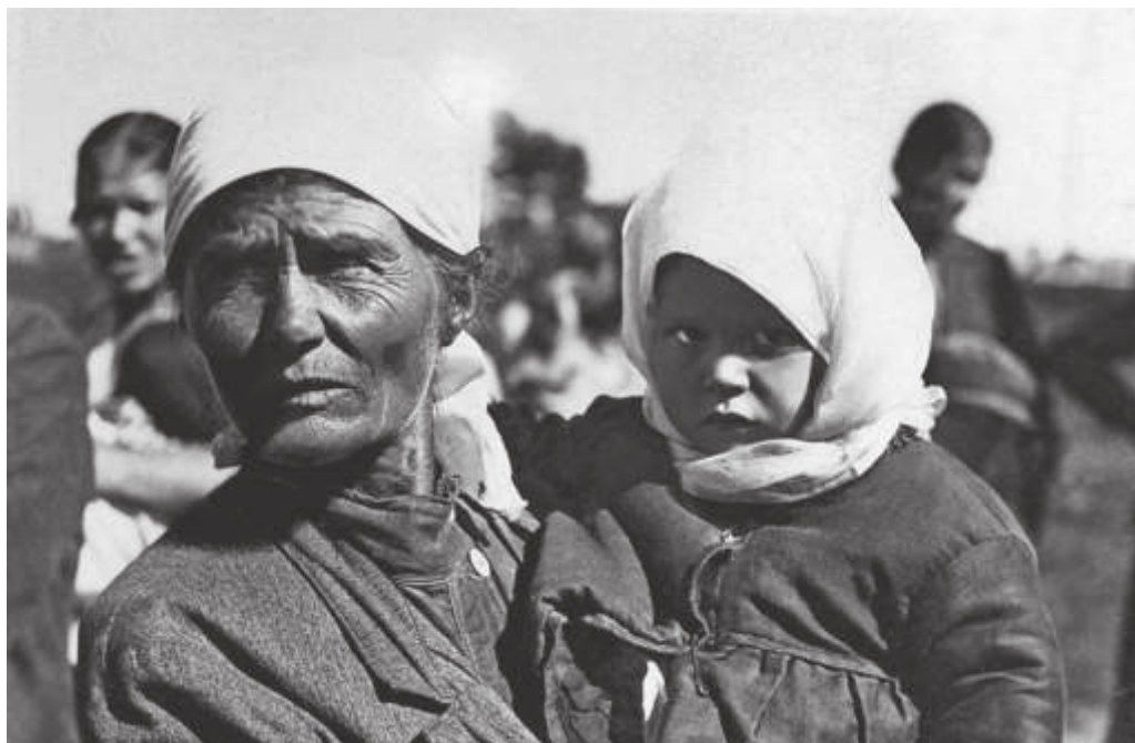
Зрители на слёте ударников строительства вторых путей БАМа. Ст. Мухинская. 1935 г.