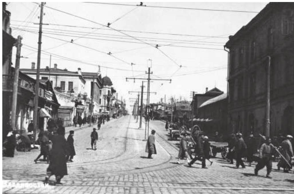
Владивосток. Китайская улица (совр. Океанский проспект). 1927—1934 гг. // ПГОМ. МПК 3943—2. Ф 7495