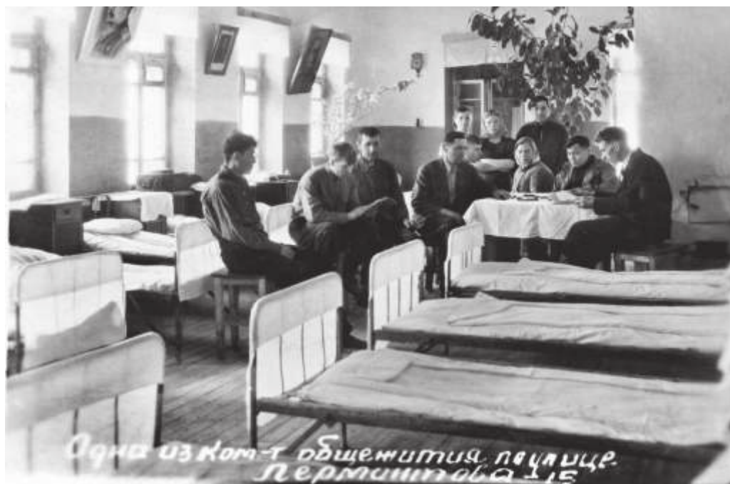
Комната в общежитии шахтёров на ул. Лермонтова в г. Артеме Приморского края. 1948 г. // ГАПК. П-1444 и