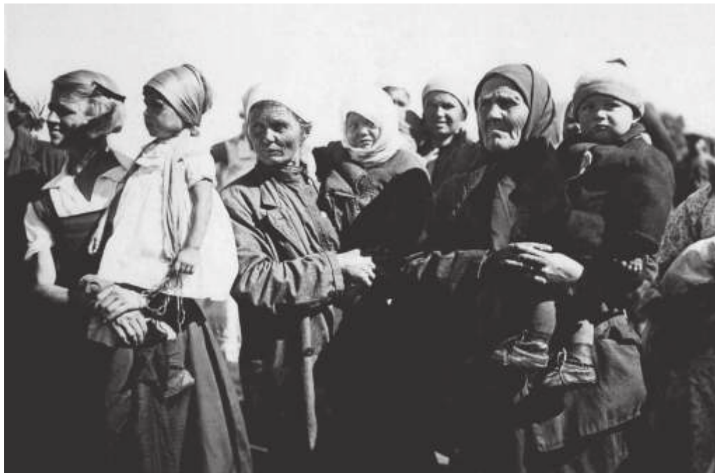
Зрители на слёте ударников строительства вторых путей БАМа. Ст. Мухинская. 1935 г. // РГИА ДВ. Ф. Р-2475. Оп. 3. Д. 18. Л. 7