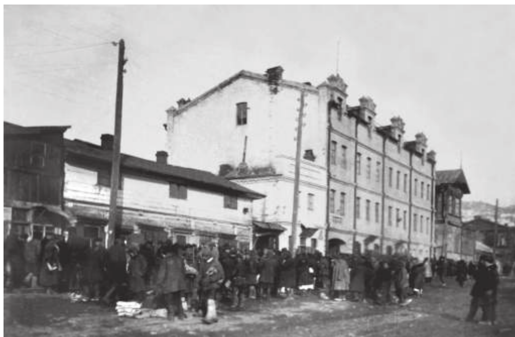
Здание «Миллионки» на ул. Семеновской г. Владивостока. 1933 г.