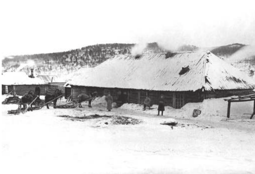
Хлебопекарня в пос. Бушуйке.

Январь 1933 г.