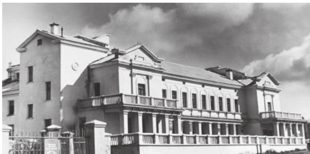
Дворец культуры горняков в г. Ворошилове. 1955 г. // ГАПК. Фотоальбом №8. Фото 29