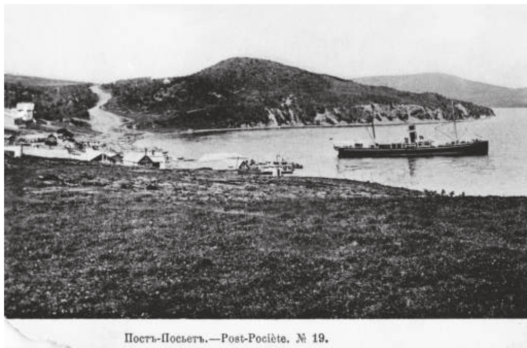
Пост Посъет. 1910 г. // ГАПК. П-2252а