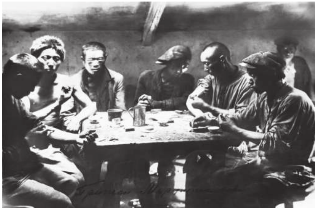
Притон морфинистов в «Миллионке». Владивосток. 1933 г.