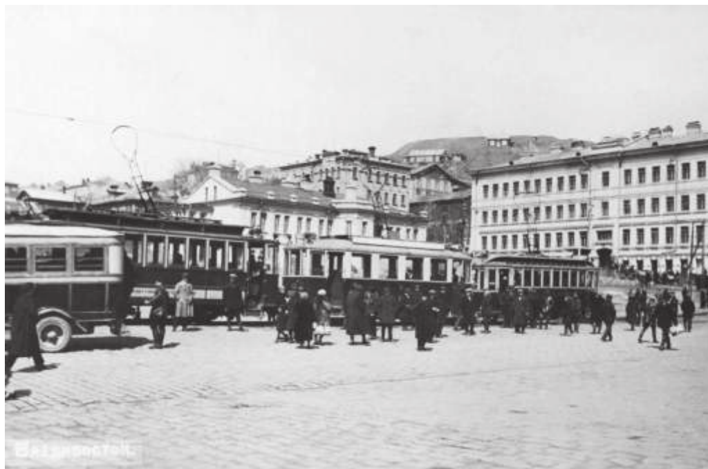
Владивосток. Привокзальная площадь. 1927—1934 гг. // ПГОМ. МПК 3943—3. Ф 29222