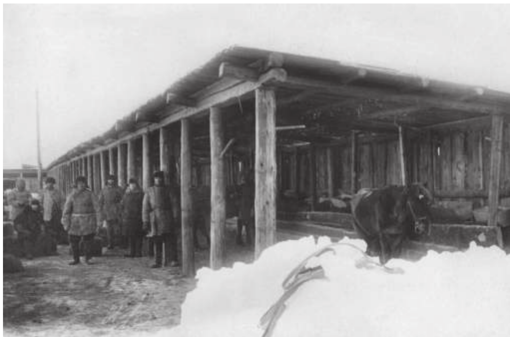
Конюшня в пос. Большом Невере. Январь 1933 г.