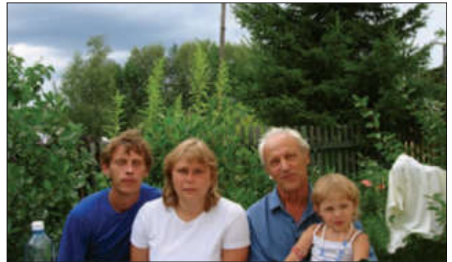
В Половинке на юбилей (70 лет)