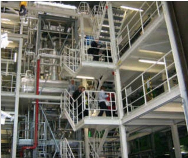
Делегация ТПУ на установке по переработке отходов в Технологическом институте Карлсруэ