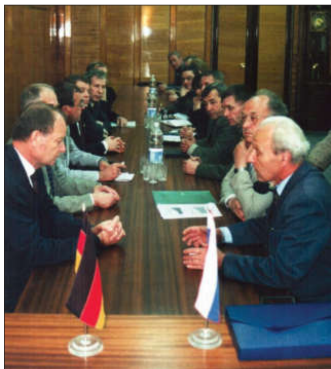
В кабинете ректора ТПУ. Переговоры с послом Германии