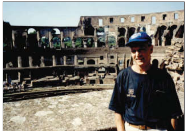
В Колизее, Рим