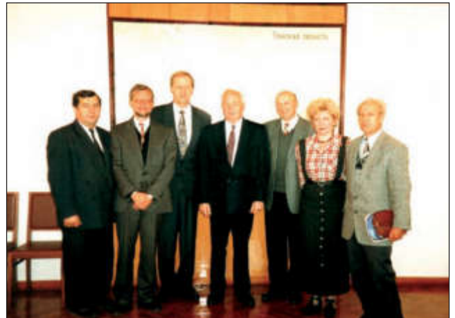
Во время приема у губернатора Томской области по ториевой проблеме