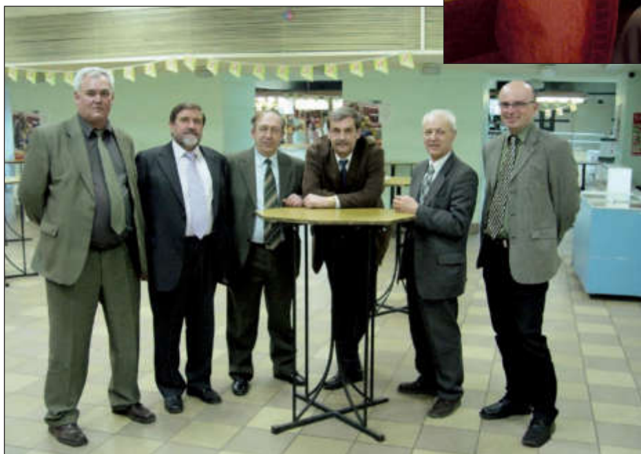
Участники проекта RAUMA в Тверской медицинской академии