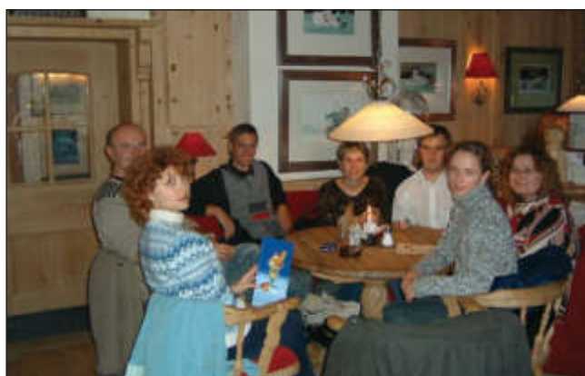
Участники проекта CROSSUM в университете Карлсруэ