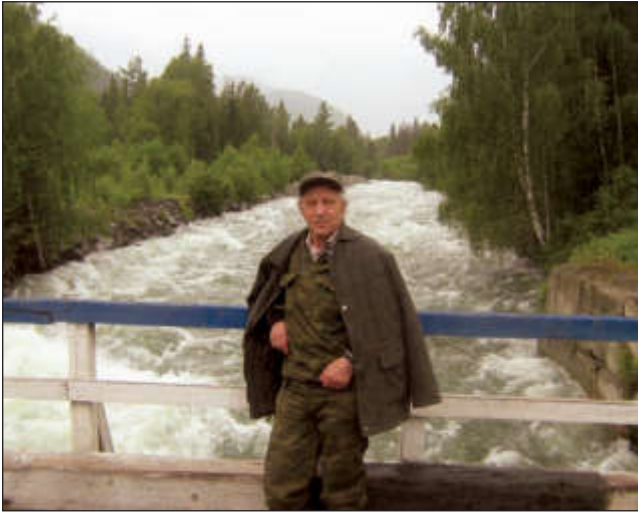
На мосту через р. Мульту