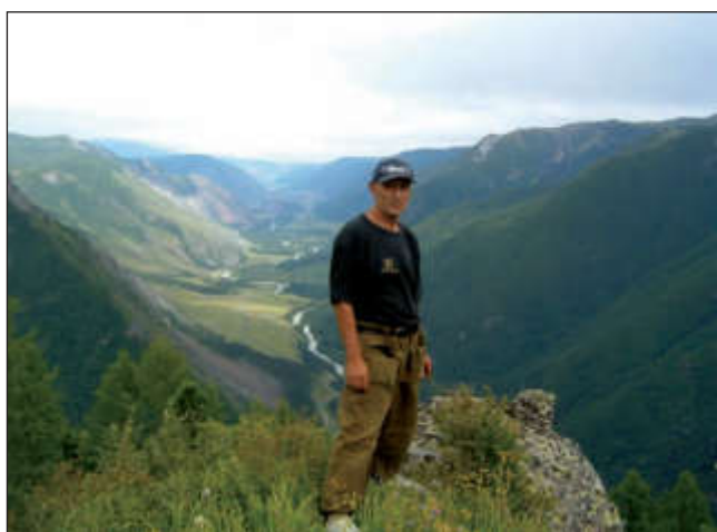
На горе в долине р. Чуя