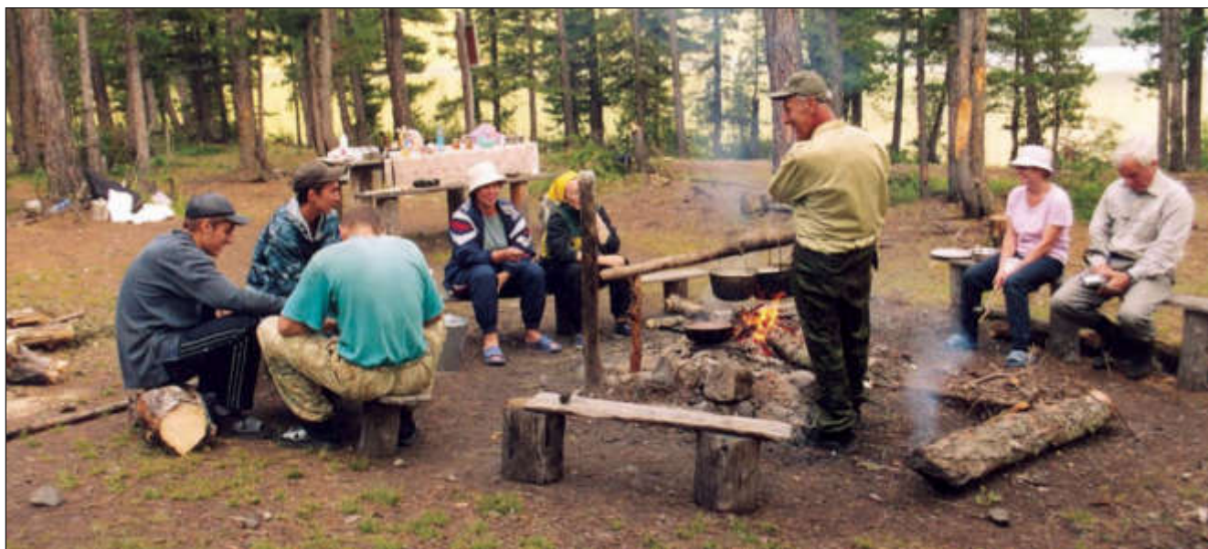
Наш лагерь у Мультинского озера