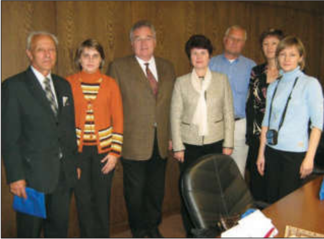
Встреча сотрудников НТБ ТПУ с директором библиотеки университета Карлсруэ