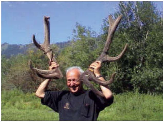
В Верхнеймонском маральнике