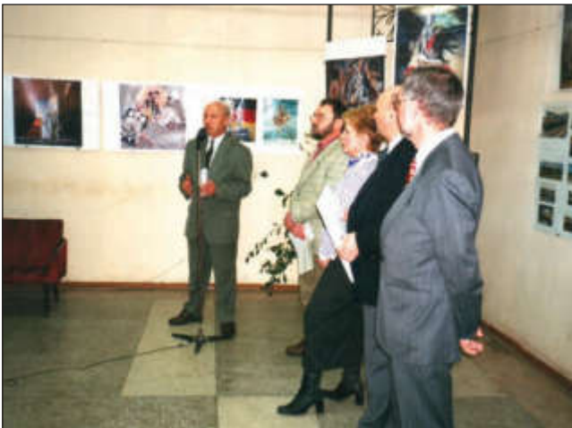
Выставка картин Г. Штуклика в НТБ ТПУ