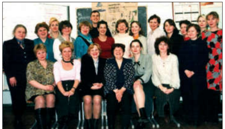
Участники семинара «Дружелюбие к клиенту»