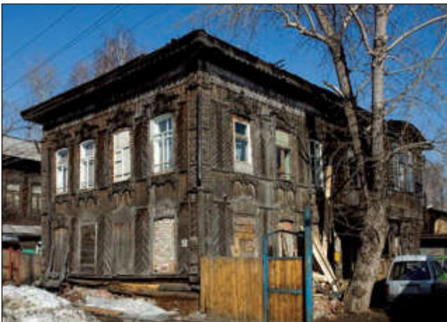
Дом по ул. Горькова, 30 в Томске