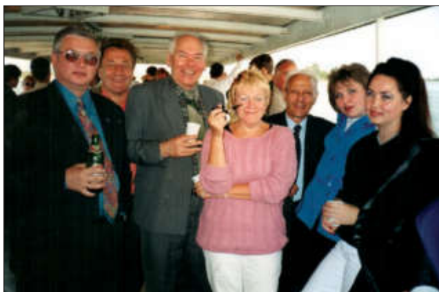
Экскурсия на теплоходе по р. Томь во время празднования 100-летия ТПУ