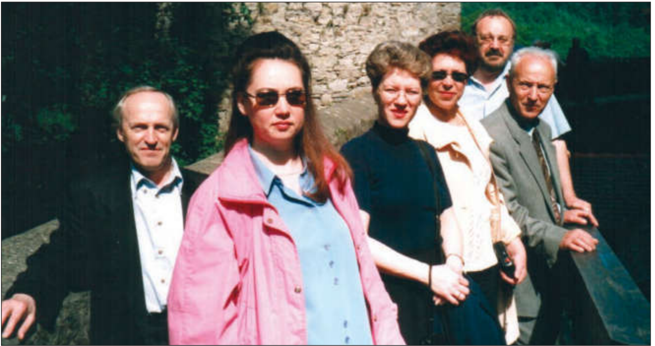
Участники проекта ТЕМПУС на экскурсии в земле Баден-Вюртемберг