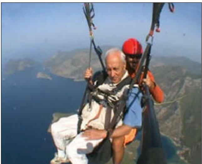
Над Средиземным морем