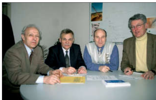
Переговоры в техническом университете Дрезден