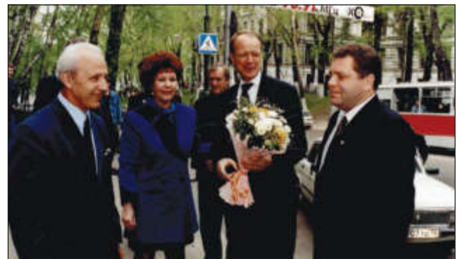
Встреча с послом Германии