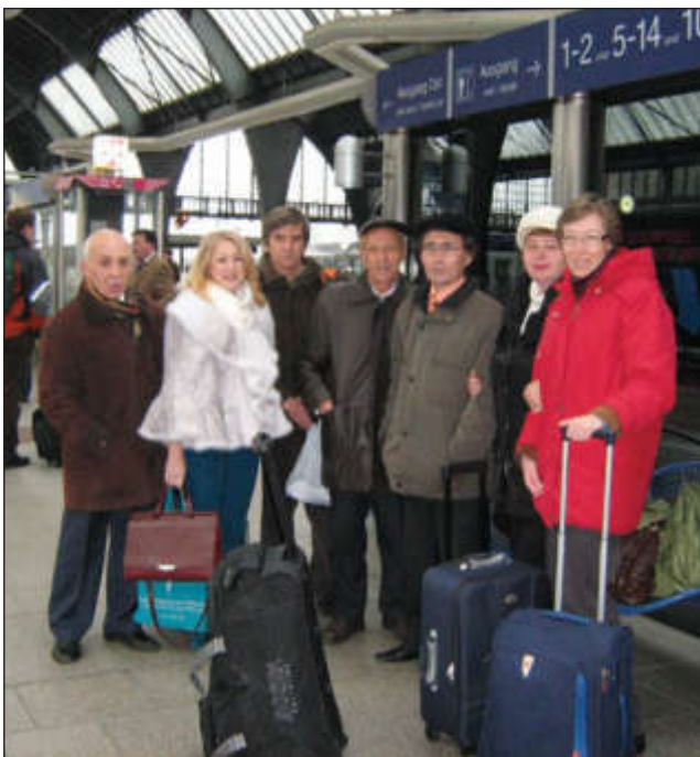
Делегация ТПУ в аэропорту Франкфурт после семинара в университете Карлсруэ по химии воды и наноструктурам