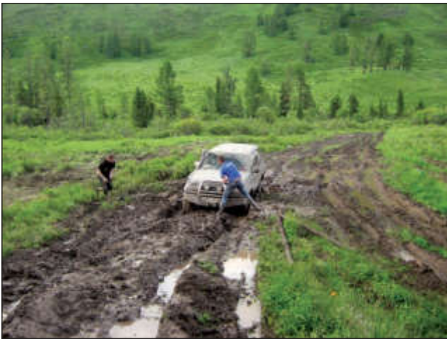
Дорога через маральник на Мультинское озеро