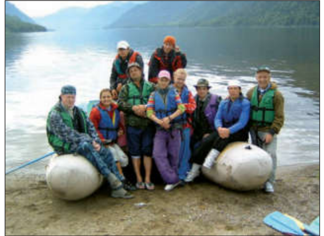
На Телецком озере