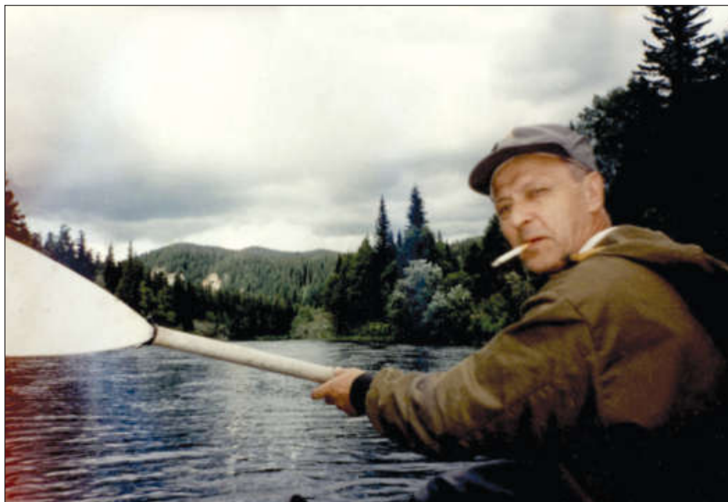
На сплаве по р. Кия от заповедника Кузнецкий Алатау