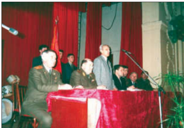
Юбилей военной кафедры