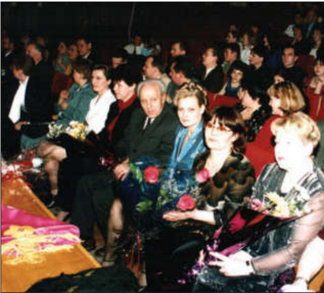
На юбилее Русско-американского центра ТПУ