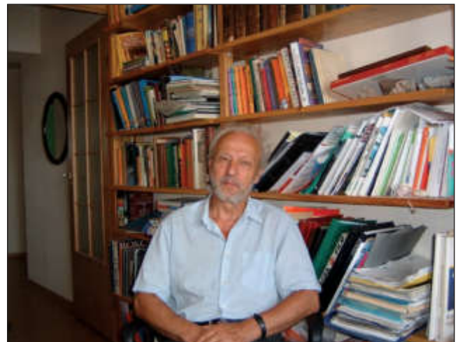
После возвращения с Алтая