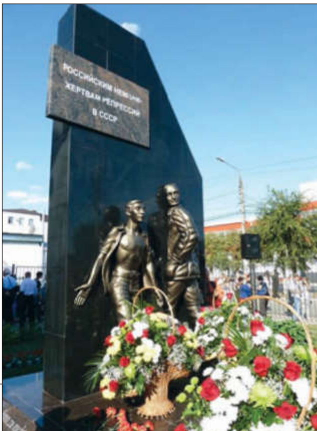
Памятник трудармейцам в г. Энгельс