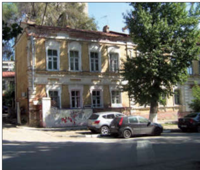
Родной дом в Саратове, ул. Рабочая,2