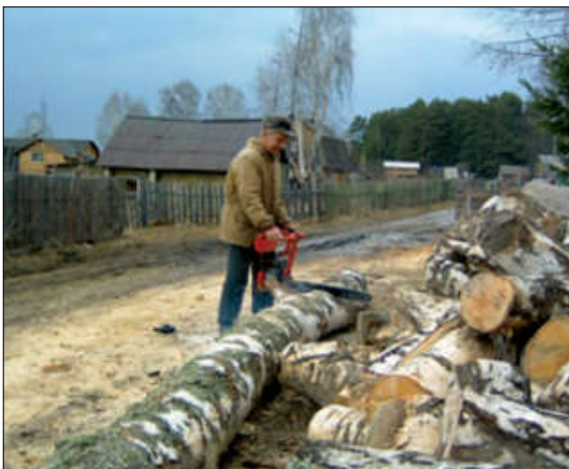
Активный отдых в Половинке