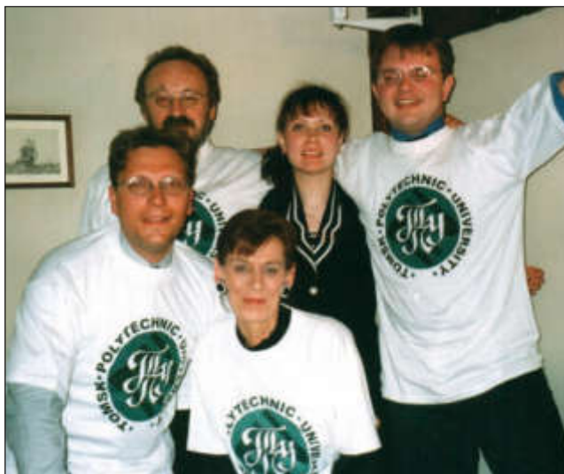
Участники проекта ТЕМПУС из Вены и Карлсруэ в ТПУ