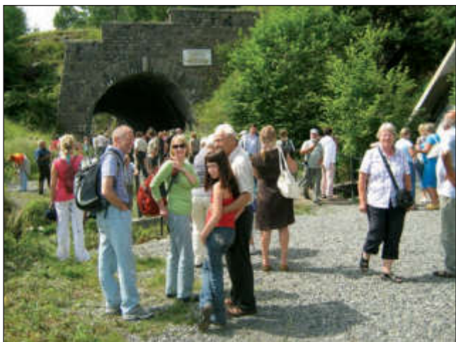
На Кругобайкальской железной дороге