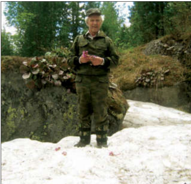
Между Мультинскими озерами (8 июля 2013 г.)