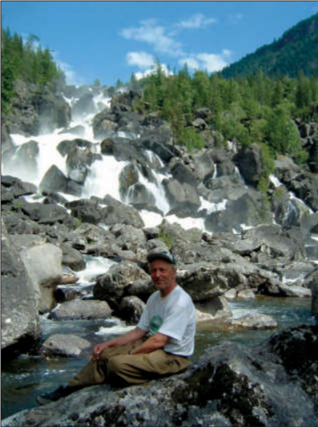
У каскадного водопада Учар (160 м) на реке Чульча, впадающей в реку Чулушман