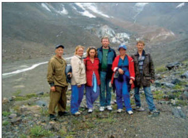
У подножья ледника Ак-Туру