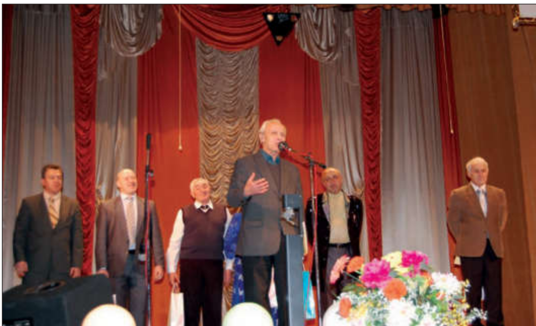
На встрече в с. Александрово