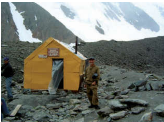
На леднике Ак-Туру у Голубого озера