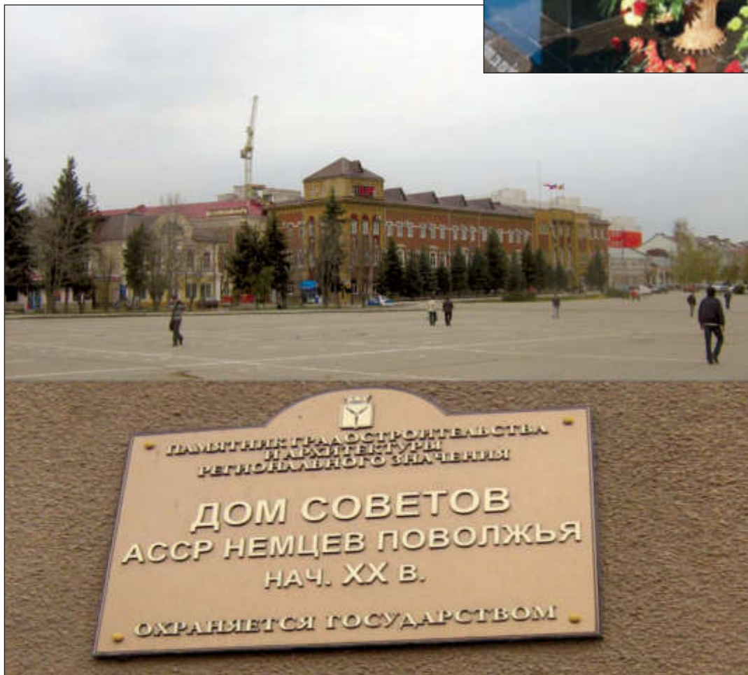
Бывшее здание Дома Советов АССР немцев Поволжья в г. Энгельс