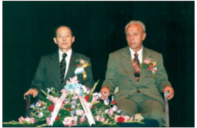
На открытии конференции KORUS в университете Ульсан (Корея)