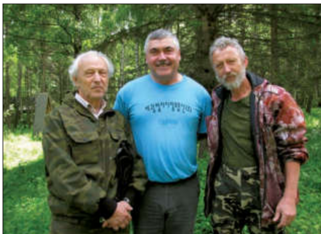
Дульзоны с министром сельского хозяйства Республики Горный Алтай С. Огневым