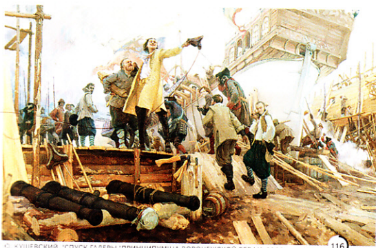
Ф. КУШЕВСКИЙ. «СПУСК ГАЛЕРИ «ПРИНЦИПИУМ» НА ВОРОНЕЖСКОЙ ВЕРФИ, 2008