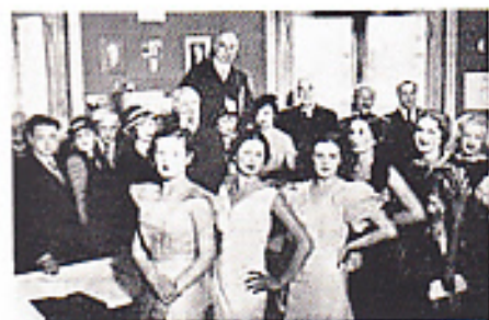
ДА ЗДРАВСТВУЕТ «МИССЬ РОССИЯ»!

Все эти годы он вел размеренную жизнь европейского буржуа — путешествовал, ходил в музей, театры, кинематограф, библиотеки. Летом отдыхал на дачах у знакомых. Любил велосипедные прогулки, коллекционировал марки. И почти ничем не был связан с Отечеством, которое в октябре 1917 года поставит на дыбы