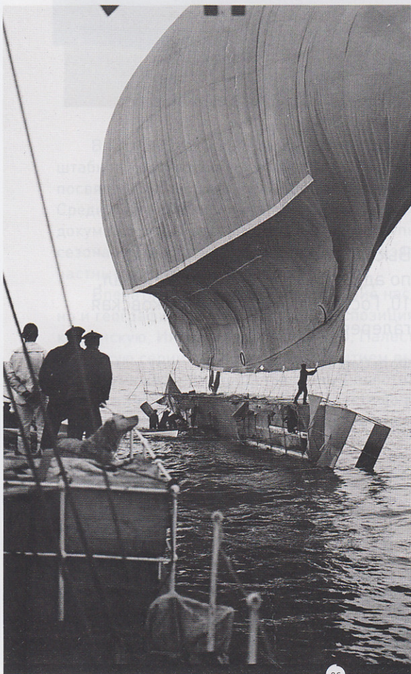
ДАТСКИЙ НАЦИОНАЛЬНЫЙ МУЗЕЙ