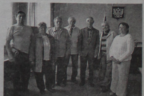
Участники заседания Зуевского отделения ВО ЖНПР