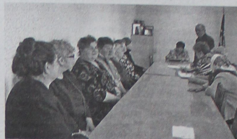
Заседание Белохолуницкого отделения ВО ЖНПР