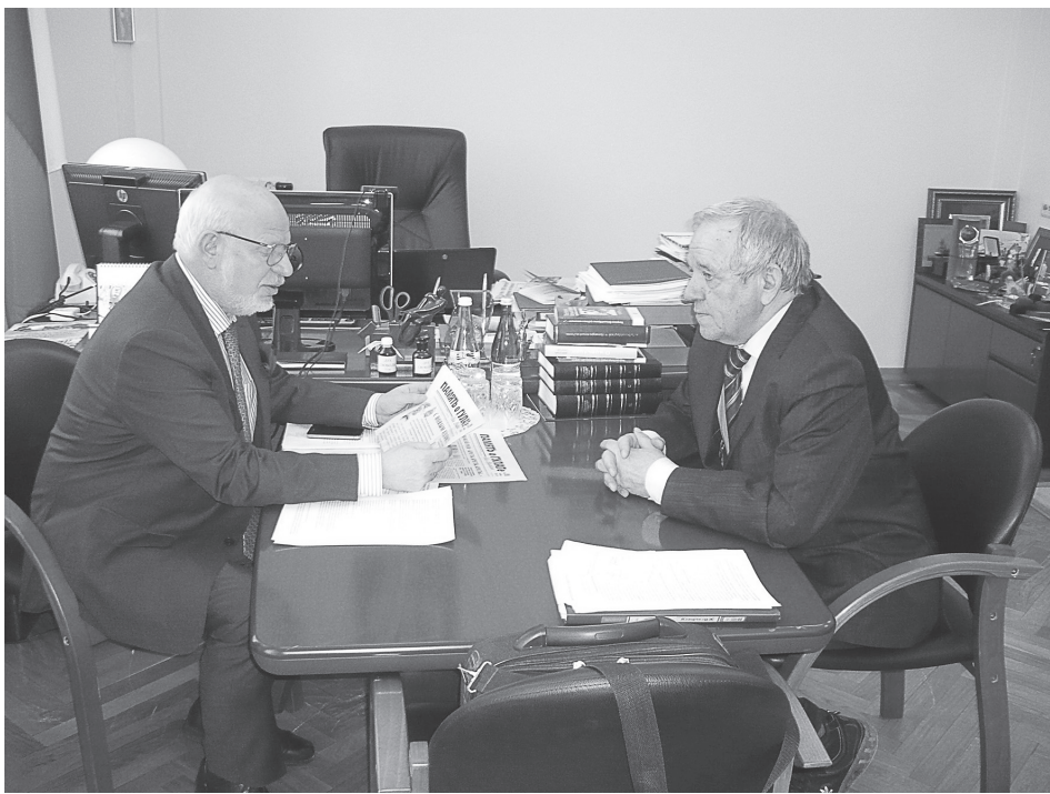
Председатель Совета при Президенте России по развитию гражданского общества и правам человека М. Федотов и председатель ВО ЖНПР М. Магдеев 28 января 2015 г.