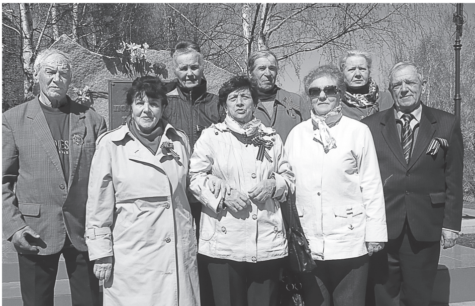
Реабилитированные у «Памятника жертвам политических репрессий» на набережной Грина, 3, г. Киров, в День Победы 9 мая 2015 года