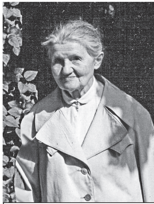
Как и положено доброй фее, она всем несла добро.

Лето у нас быстро пролетело, тоже вторая половина была до-