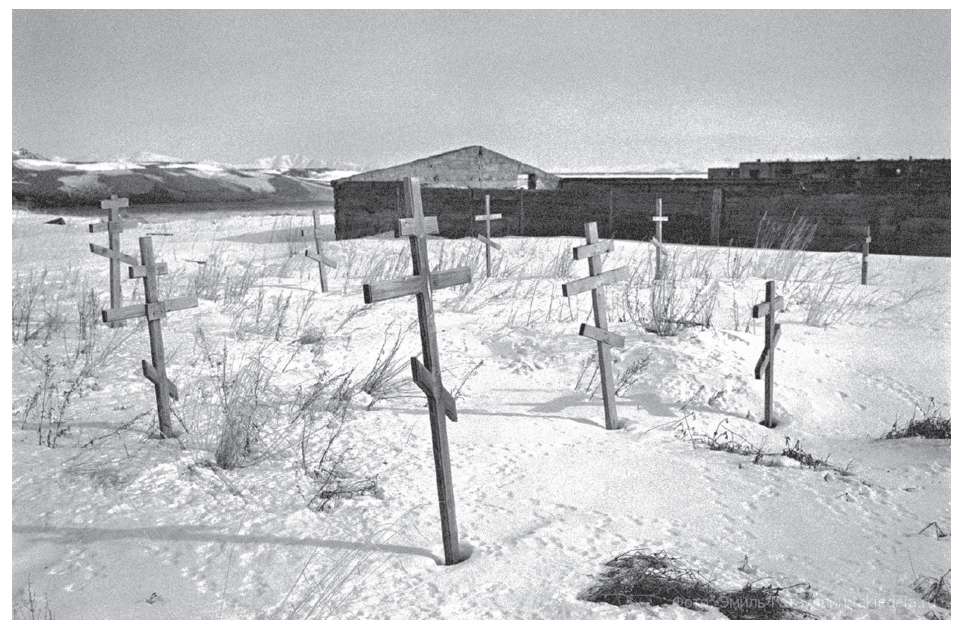
Пришла телеграмма тогда, когда ехать было уже не к кому. Впрочем, приди она раньше, результат был бы таким же.

Последнее из сохранившихся писем родным написано 24 июля 1945г.: «Милые Мамик и Рона, меня всё последнее время мучила совесть, что я так долго Вам не писал и не теле-