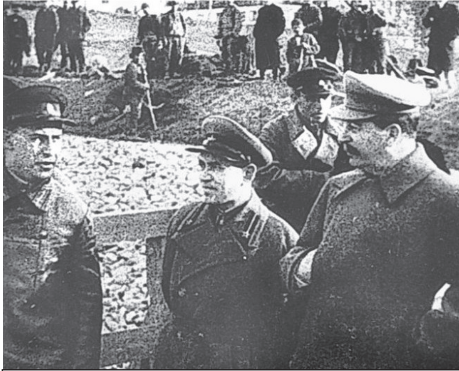
«Ленинградский вождь» лично контролировал и строительство Беломорско-Балтийского канала, где сотни тысяч заключенных с помощью кирок и тачек, в труднейших природных условиях за 20 месяцев протыкали канал протяженностью свыше 200 километров.