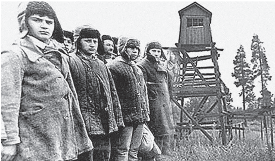
Известно, что многие заключенные даже награждались орденами и медалями за проявленные на фронтах Великой Отечественной доблесть и героизм.