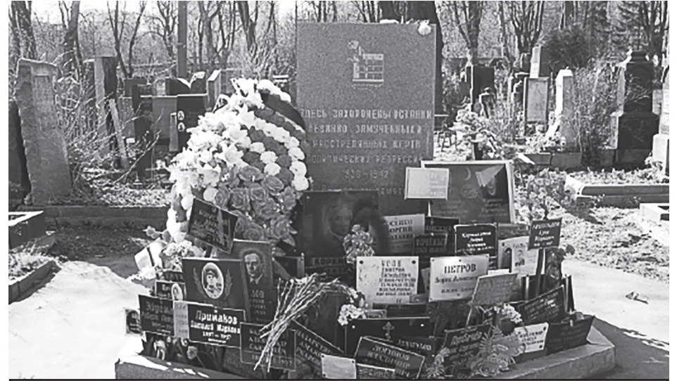
Одно из захоронений прахов расстрелянных на Донском кладбище.

Вскоре после смерти Сталина Блохина торжественно проводили на пенсию по состоянию здоровья с объявлением благодарности за многолетнюю «безупречную работу». А в 1954 году хрущевская десталинизация лишила его генеральского звания, почетной пенсии и всех наград.