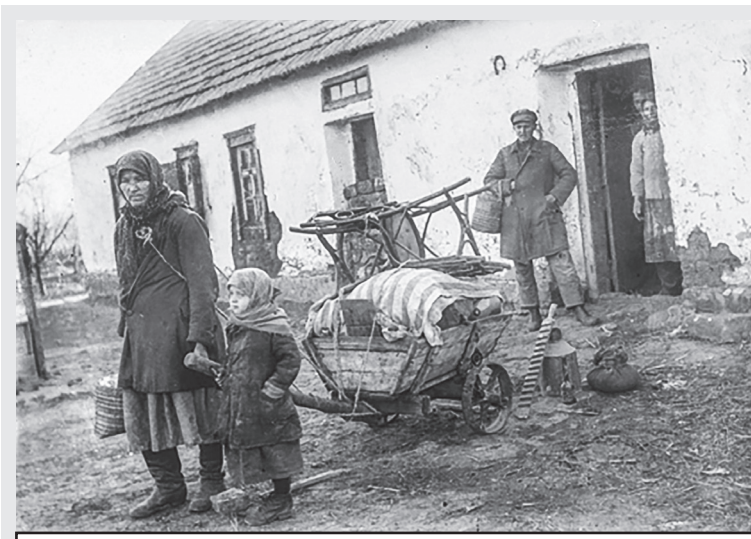
Раскулаченная семья возле своего дома, село Удачное, Донецкая область, 1930 год.

Но как сообщить родственникам? Заключенным раз в день выдавали паек. Часто это была несъедобная се-