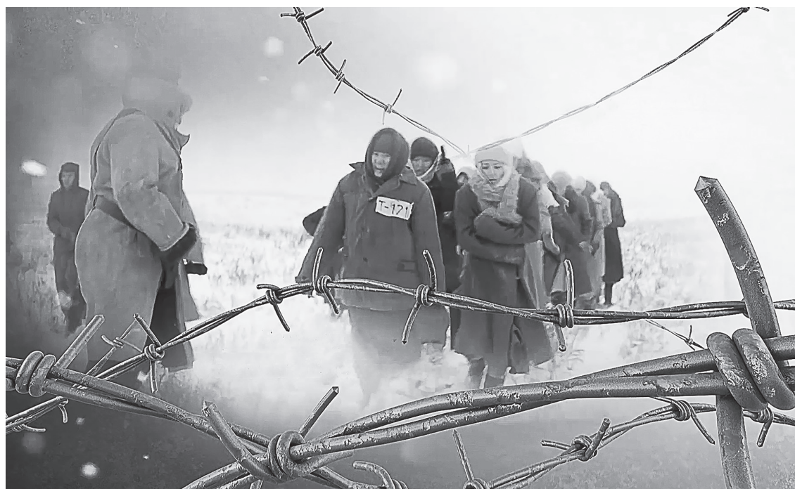
Этапом через АЛЖИР прошло свыше 18 тысяч женщин, более восьми тысяч отбыли срок «от звонка до звонка». На территории лагеря родилось 1,5 тысячи детей, изъятых впоследствии у матерей.

Репрессии не заканчивались после освобождения. У женщин в паспорте стояла отметка, что им запрещено въезжать в большие города. Многие так и остались в Казахстане. Кроме того, такая отметка не позволяла найти достойную работу. Все имущество у них отняли еще при аресте. О том, что их мужья расстреляны, многие узницы узнали только после освобождения. Они до последнего надеялись, что супругов также держат в лагерях.