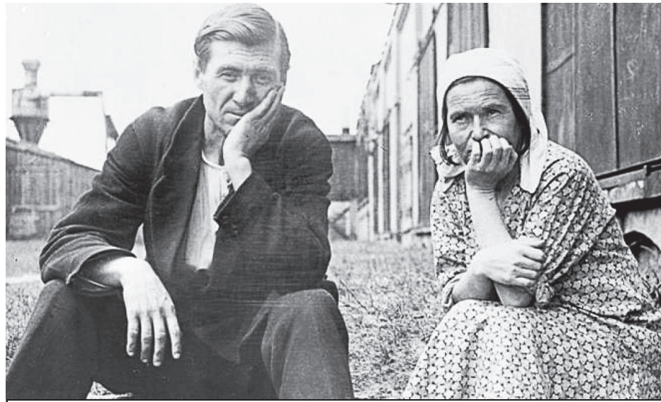
Одна из фотографий передвижной экспозиции «Немцы в российской истории» посвященной 250-летию массового переселения немцев в Россию.

Давно лишили памяти о том, для чего она была создана еще 30 лет назад, и российско-германскую Межправительственную комиссию по восстановлению государственности российских немцев. И делаются все