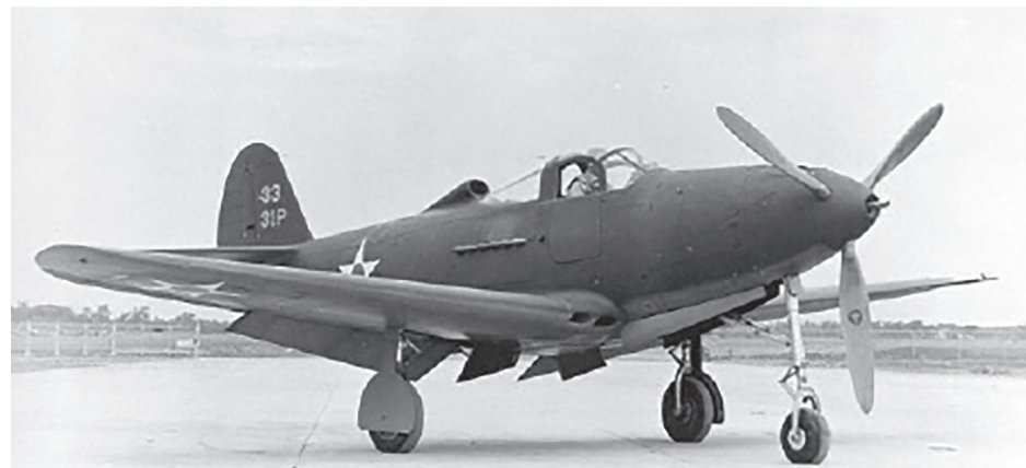
Истребитель P-39N «Airacobra» с номером 100. На нем летал трижды Герой Советского Союза Александр Покрышкин.

мые для отражения нацистского вторжения в СССР. Только из США в СССР было направлено около 400 000 джипов и грузовиков; 22 150 самолетов; 12 700 танков; 2,7 млн тонн нефтепродуктов и 2077 млн банок тушенки.