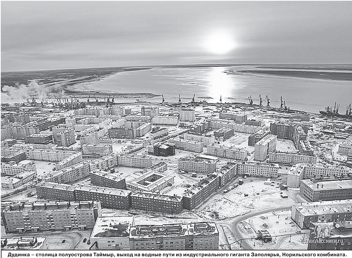
Дудинка – столица полуострова Таймыр, выход на водные пути из индустриального гиганта Заполярья, Норильского комбината.