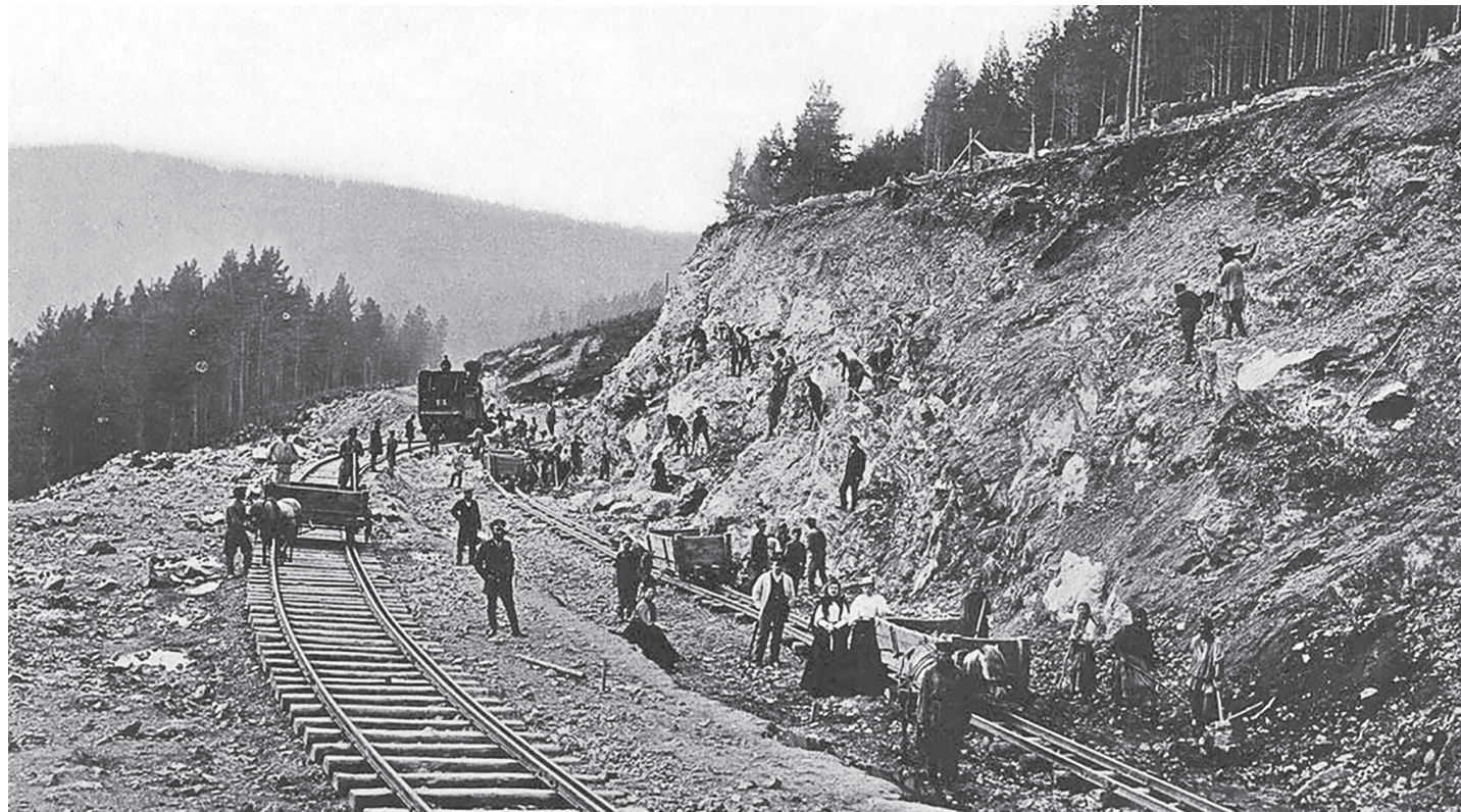
Освоение необработанных плодородных земель (чернозёма) в низовьях Оби и её притоков, в частности в Омской области, шло вдоль Транссибирской железной дороги.

Первой его книгой стал перевод романа немецкого классика Михаэля Энде «Момо». Глава из нее включена в пособие по изучению немецкого языка и германского образа жизни для переселенцев (ещё в России). Далее у автора наступило время Богоискательства. В результате сопоставления и осмысления ряда исследований на тему возникновения или творения Вселенной автор пришел к выводу, что материалистиче-