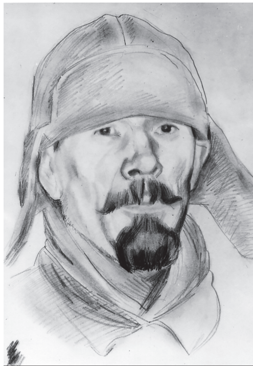
Н.А. Мамонтов. Портрет Н.А. Бруни в шлеме. 1937. Бумага, карандаш. 35,5 x 24,5. Омский областной музей изобразительных искусств им. М.А. Врубеля.